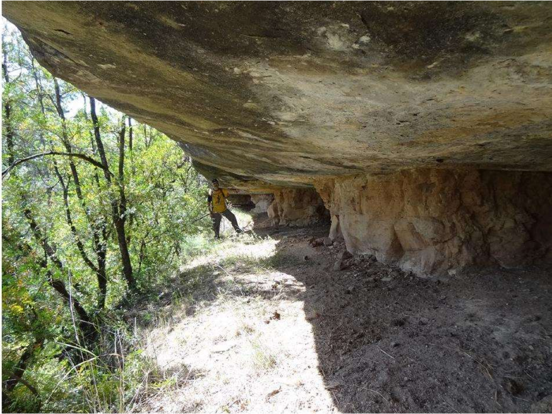
Balma de les Cambres de la Llera