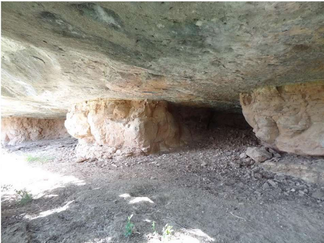
Balma de les Cambres de la Llera