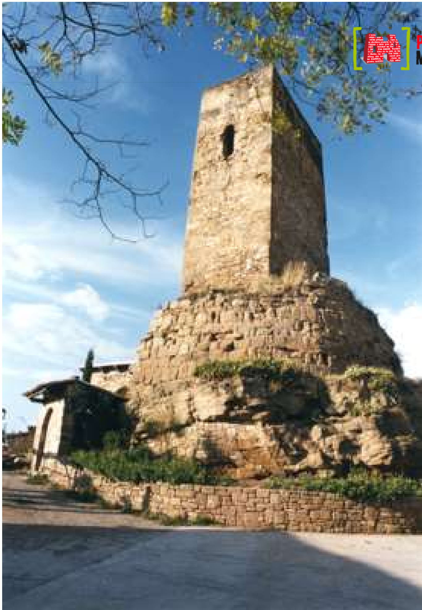
Imatge de la Torre d'Ardèvol, Pinós (Solsonès)2002. Autor: Jordi Contijoch Boada. Generalitat de Catalunya, Departament de Cultura

Utilitzem galetes pel correcte funcionament tècnic del web.