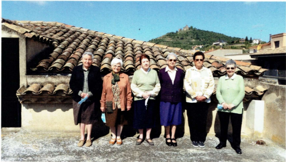
Figura 25: La comunitat 2020

Imatge del "Llibret de comiat de la Companyia de Maria de Solsona 1758-2020"