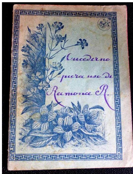
Quadern de Ramona Ramonet Torrent de l'any 1909.

És de suposar que l'ensenyança que hi rebé (les quatre regles, cosir, brodar, fer ganxet, doctrina cristiana...) l'ajudà a ser la bellíssima i alegre persona que estimo, recordo i porto dins el cor.