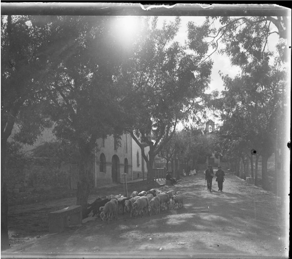
Quadres i casa en temps de Cal Pujolar_ foto ACS

El Pujolar era un home que viatjava per les principals fires de Catalunya i va voler fer-se una casa distingida, d'acord amb els nous gustos del moment. Va demanar a un jove arquitecte vingut a Solsona per fer un aixecament planimètric de la catedral, Francesc Folguera i Grassi, que li fes uns plànols. Folguera va arribar a ser un destacat arquitecte noucentista que va intervenir en obres destacades, com el Poble Espanyol de Montjuïc, per a l'Exposició Internacional de 1929, o la façana principal i la torre de l'abat del Monestir de Montserrat. A partir dels plànols de Folguera, però amb moltes modificacions, el constructor Pere Mosella Isanta, àlies Peret Florencio, va construir la casa.