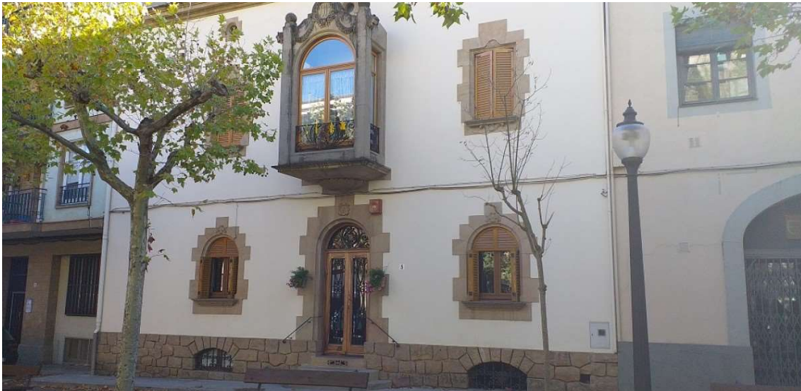
Façana de Cal Metge Casas

NacióSolsona - Solsona - 3 de novembre de 2019