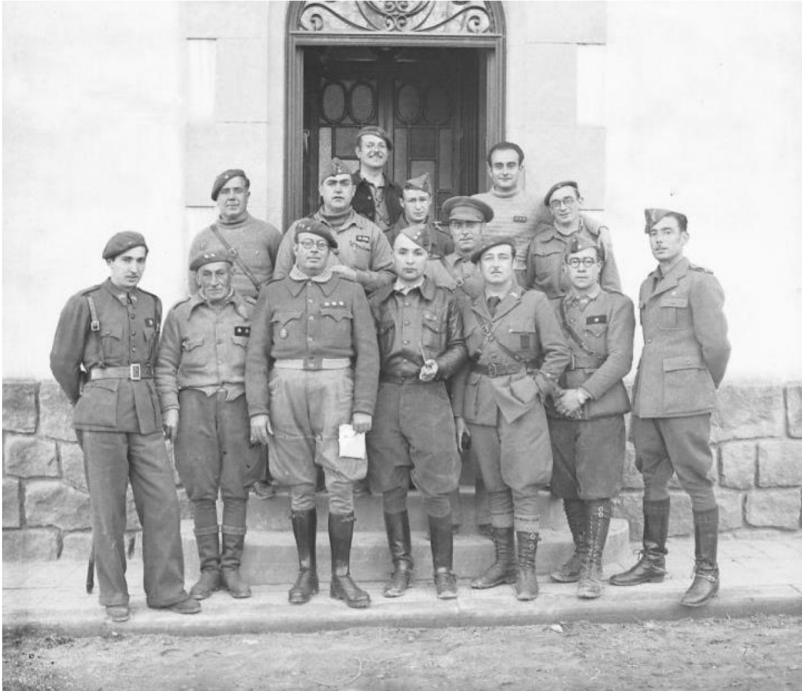
Oficials exèrcit franquista allotjats a la casa l'any 1946.