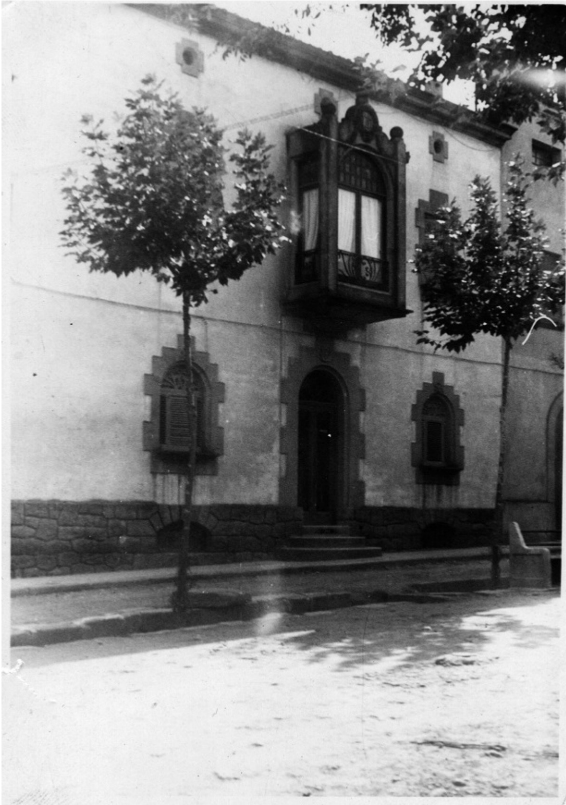
Casa_metge_casas_Fons fons familiar Padró-Casas