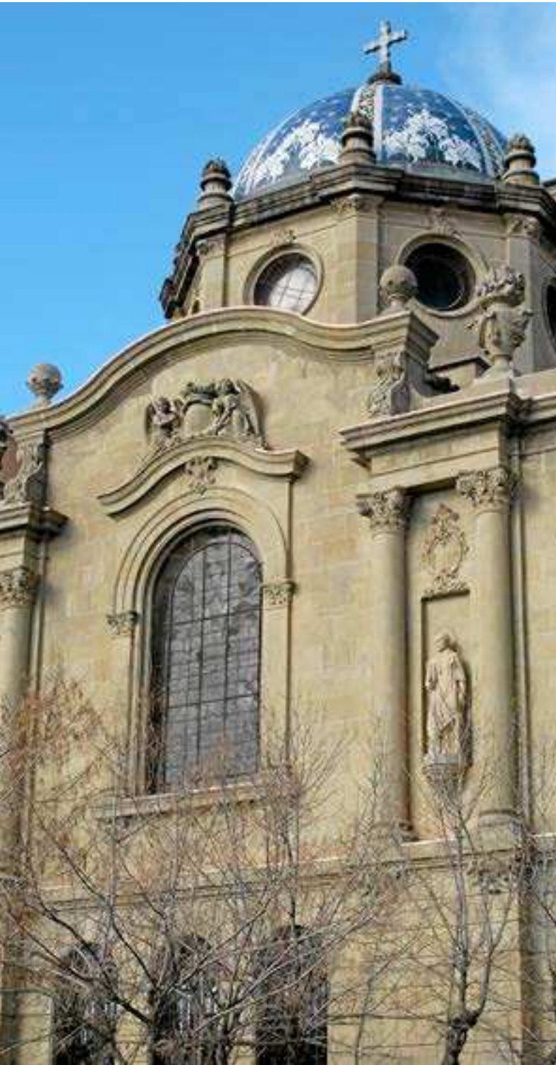
Exterior del Cambril de la Mare de Déu del Claustre. L'ampliació projectada a principis del segle XX va acabar el cicle constructiu del conjunt catedralici, iniciat al segle XI. ACC

la Mancomunitat de Catalunya i es dedica a realitzar obres com el projecte del monestir de Montserrat i les corresponents al Claustre de Solsona. El conjunt de plànols i documentació que Puig realitza és extraordinari, estudia acuradament totes les parts i detalls de l'obra que projecta, arribant a dibuixar a escala 1:1 el tron projectat.