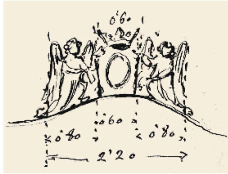
Esbós realitzat per August Font. Correspon al conjunt escultòric que corona el finestral de la façana de migdia.

August Font concep el projecte com la unió en angle recte de la façana de llevant de la Catedral amb la façana de migdia del palau episcopal. El Cambril actua com una frontissa entre dues edificacions aparentment tan diferents com són uns absis romànics i una façana neoclàssica. El conjunt constitueix una combinació entre l'historicisme i el modernisme. L'obra finalitzà l'any 1910. La integració que actualment mostra el Cambril dins el conjunt catedralici i el palau episcopal no sempre ha tingut el consentiment dels solsonins. En una publicació de l'època, el fotògraf solsoní Adolf Mas escrivia una carta oberta a Joan