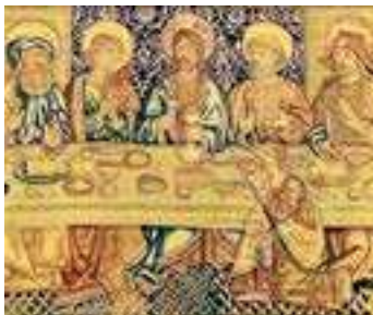
Portada: Fragment del tapís del Sant Sopar. Catedral de Tortosa