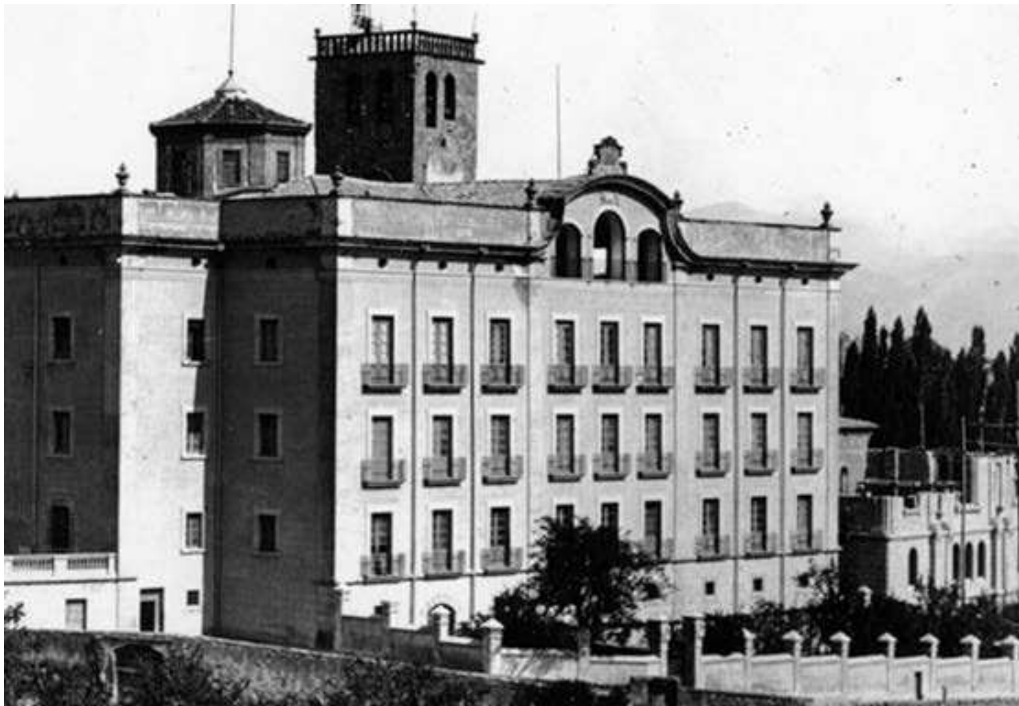
Exterior del cambril en construcció. Imatge corresponent a la primera fase de les obres del Cambril. Encara podem observar l'existència de l'antiga façana