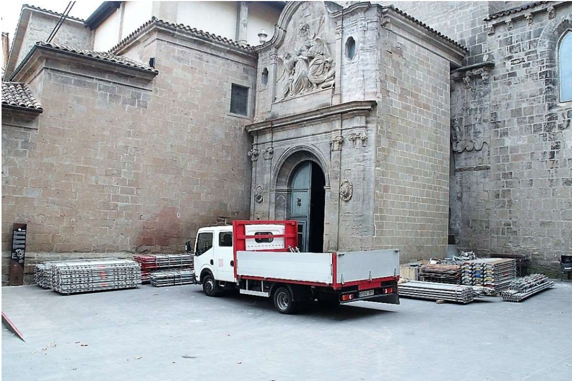
Material de la bastida a l'espera de ser muntat, a la porta d'entrada de la Catedral