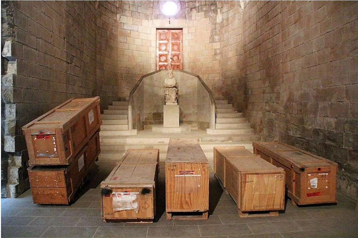
En aquestes caixes de fusta es guardaran els 3.000 tubs

El cost total de l'actuació és de 671.762,85 €, i això representa una quantitat molt elevada per a una ciutat i una diòcesi petites. Afortunadament, la societat solsonina s'hi ha abocat amb il·lusió, i paradoxalment, malgrat la crisi de la pandèmia, s'han complert les expectatives. Gràcies també a l'ajut de subvencions importants del Govern i d'Europa, que arribaran els propers anys, s'ha cobert pràcticament tot el pressupost, faltant una modesta quantitat assumible amb noves campanyes de mecenatge i patrocini.