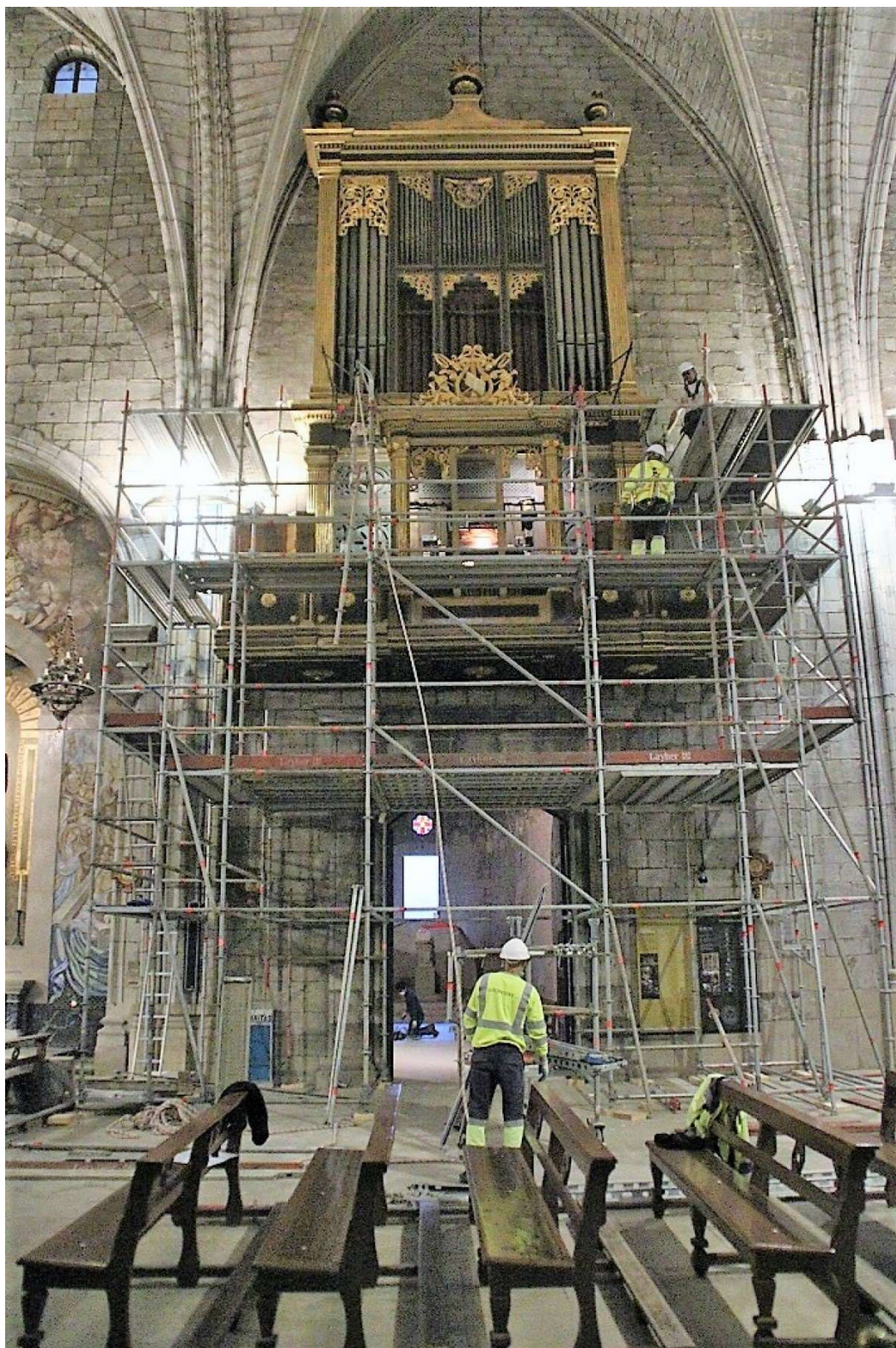
Operaris muntant la bastida aquesta setmana a la Catedral | Ramon Estany

NacióSolsona - Ramon Estany, Solsona - 29 d'octubre de 2020