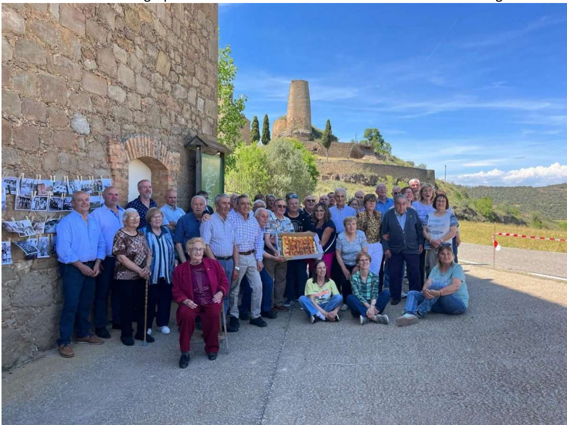
Foto de record amb un grup d'antics alumnes de l'escola de Lloberola de diverses generacions

Diumenge passat, uns 140 antics alumnes i veïns de Biosca i de Lloberola van celebrar el centenari de l'escola, actualment reconvertida com a local social. Per a la jornada es van recuperar alguns dels seus elements, com taules i mapes que havien conservat els veïns. Al costat de la porta del centre es va instal·lar una exposició de més de cinquanta imatges de l'antic col·legi.