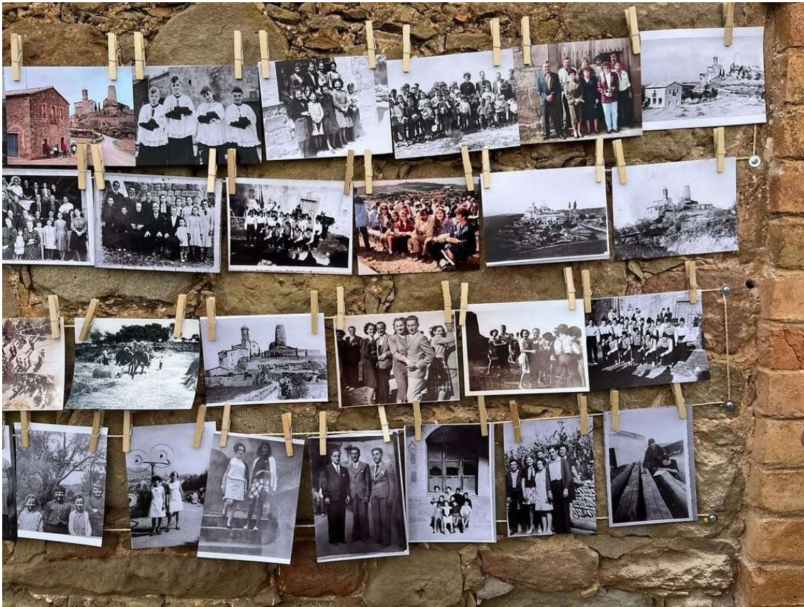
Un recull de fotografies plenes de records