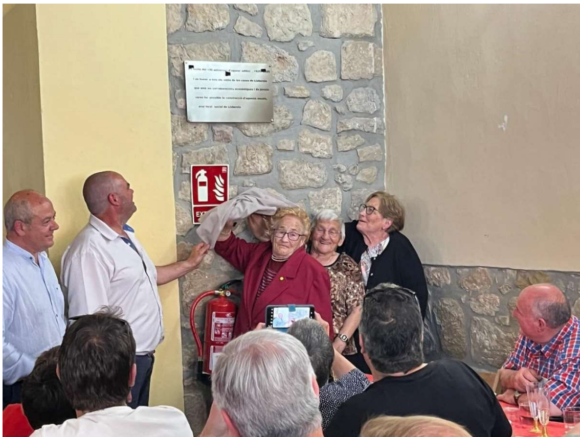
L'alcalde i una representació dels antics alumnes van destapar la placa

Lloberola anys enrere havia estat un municipi independent que amb els temps es va agregar a Biosca i on actualment només hi viu avui una família. Aïllat per les comunicacions, els camins i les carreteres són un luxe que només ha arribat els darrers anys gràcies a la carretera de Solsona a Guissona o l'enllaç fins a Sant Climenç.