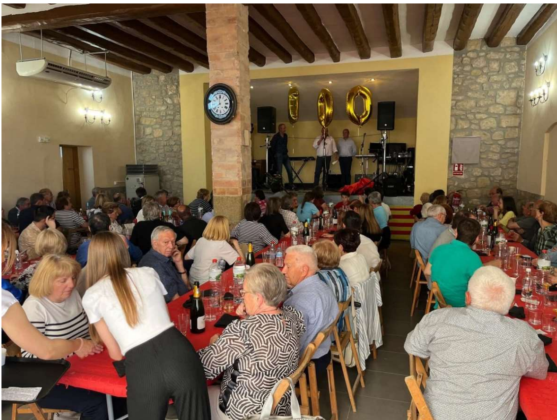
No hi va faltar el dinar de celebració