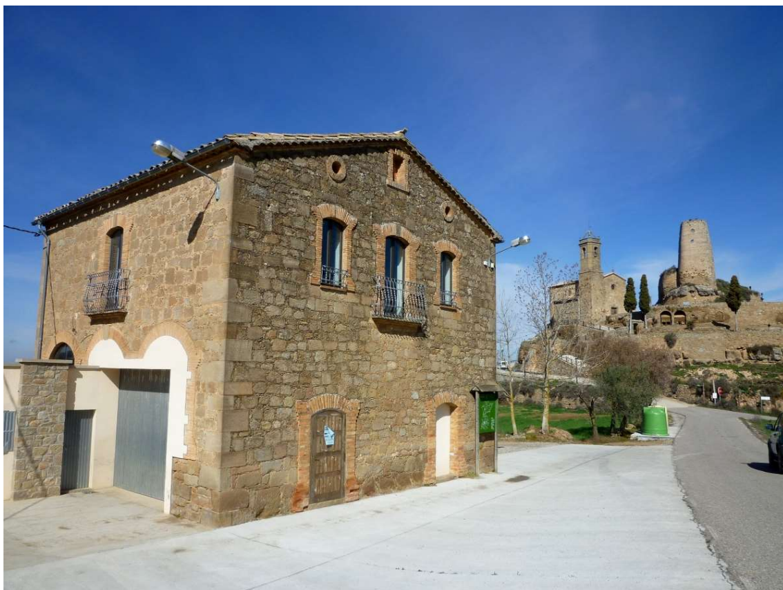
L'estudi de Lloberola Isidre Blanc

L'Estudi de Lloberola és un edifici del poble de Lloberola, al municipi de Biosca (Solsonès) que forma part de l'Inventari del Patrimoni Arquitectònic de Catalunya. Antigament era l'escola on anaven els nens de Lloberola i els voltants, amb el pas dels anys i amb l'accentuat descens de la població que ha patit la zona, l'escola va haver de tancar.