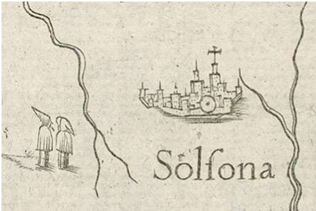
El convent de Solsona en el mapa titulat Provincia Cataloniae cum confinijis (1649)

El 1611 van impulsar la seva ampliació, enderrocant l'antiga ermita i aixecant una construcció nova, però el bisbe de Solsona els va demanar que aixequessin el convent en un lloc més proper a la vila amb la finalitat de poder atendre millor la població; el 1624 es va posar la primera pedra d'aquell nou edifici.