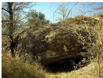
Olius, Cova d'Aigües Vives.

Una estructura tant o més complexa era la existent a la cova d'Aigües Vives de Brics, al terme d'Olius, on sota d'una visera de roca si va erigir un espai tancat pel davant i pels costats amb lloses verticals. Dintre d'aquesta hi foren enterrats un centenar d'individus