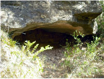
Olius, Cova de la Talaia I.