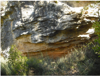
Riner, Frexinet, Balma de Soler Brocó, Balma 1.