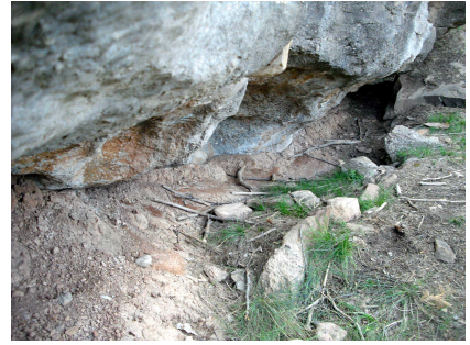
Rajadell, Balma de Can Bosc.