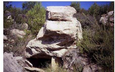
Sant Mateu de Bages, Cau de la Guineu.

Un altre cas d'enterrament sota roca, és el del Cau de la Guineu, dintre del terme de Sant Mateu de Bages. Aquesta contenia en llur interior una cista feta amb lloses, de 0'40 metres d'alçada, 1'40 metres d'ample i uns 2 metres de longitud; contenia un reompliment d'ossos humans i també com en la cripta descrita anteriorment, l'aixovar era mínim: fragments de ceràmica i un botó de pedra amb perforació en "V". El més interessant de llur contingut era una trentena de cranis humans seleccionats, i un amuntegament d'altres parts de l'esquelet.