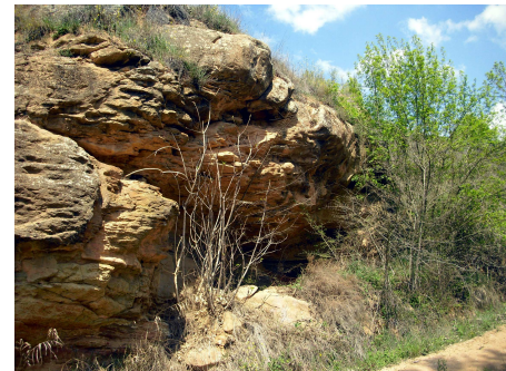
Torà de Riubregós, Cova de Fontanet.

Una d'encara més recent, es la balma de Fontanet a Torà de Riubregós. Es tracta d'una cavitat natural sota d'un voladís de la cinglera, orientada al sud-oest, en la que es va excavar en el seu extrem sud-oest un espai rectangular d'uns 2 metres de llarg, 1 metre d'amplada i 0'50 metres de fondària per adequar-lo com a recinte sepulcral. Les seves dimensions són 8 '10 metres d'amplada, 1' 90 metres d'alçada i 2 '80 metres d'alçada des de pla de la visera que cau.