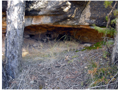
Pinell, Cova de Sant Sentís.