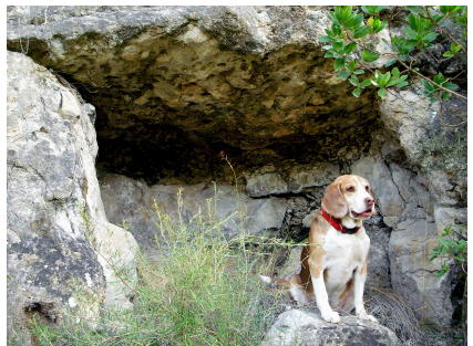
Viver i Serrateix, Racó dels Ossos de Cal Teuler.

Les criptes sota roca també conegudes com “coves amb façana megalítica”, han estat incloses sense gaire encert dintre del món dels paradòlmens, que són estructures completament diferents i amb una altra intencionalitat; aquests sota roca eren una alternativa econòmica als sepulcres megalítics als quals mossèn Serra i Vilaró va anomenar “Dolmens de pobre”; normalment es presenten com espais tancats sota d'una visera rocosa, després d'haver-hi extret la terra. Moltes vegades aquestes cavitats eren retocades amb lloses plantades verticals, tant en el laterals de la cripta com en l'accés, constituint així una mena de cista amb coberta natural. Les tanques s'efectuaven, si no hi havia caixa sepulcral, amb lloses clavades al sòl de l'entrada, el que ha deixant marques d'encaix en la roca. La curiositat envers la conservació dels cadàvers va arribar fins l'extrem de cobrir a més els cossos amb llosetes. Foren profusament utilitzades durant el neolític final-calcolític i el bronze antic. S'estenen sobre tot per la Catalunya Central i en ambients de pràctiques agrícoles més que ramaderes, doncs pels seus voltants s'hi troben planes fèrtils que encara ara es dediquen a l'agricultura.