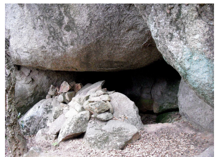
Calonge d'Empordà, Cova de la Roca Negra.