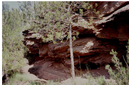
Sallent, Balma dels Ossos. Crani 1.

Entre les criptes sepulcrales sota roca, més recentment excavades, una és la balma dels Ossos de la Torre, a Cornet, terme de Sallent, on s'identificaren dues etapes d'utilització: la primera a principis del calcolític, cap el 2800 aC.;