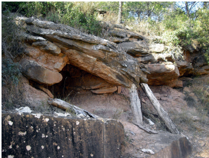
Súria, Balma del Samuntà.