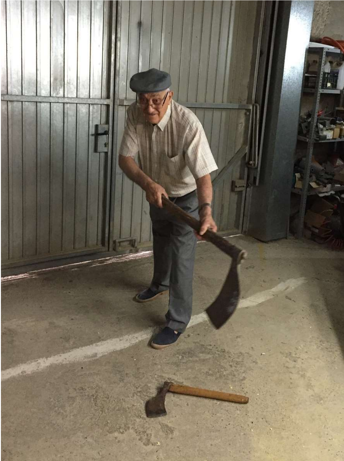
Posició de la destal per a pelar pins.