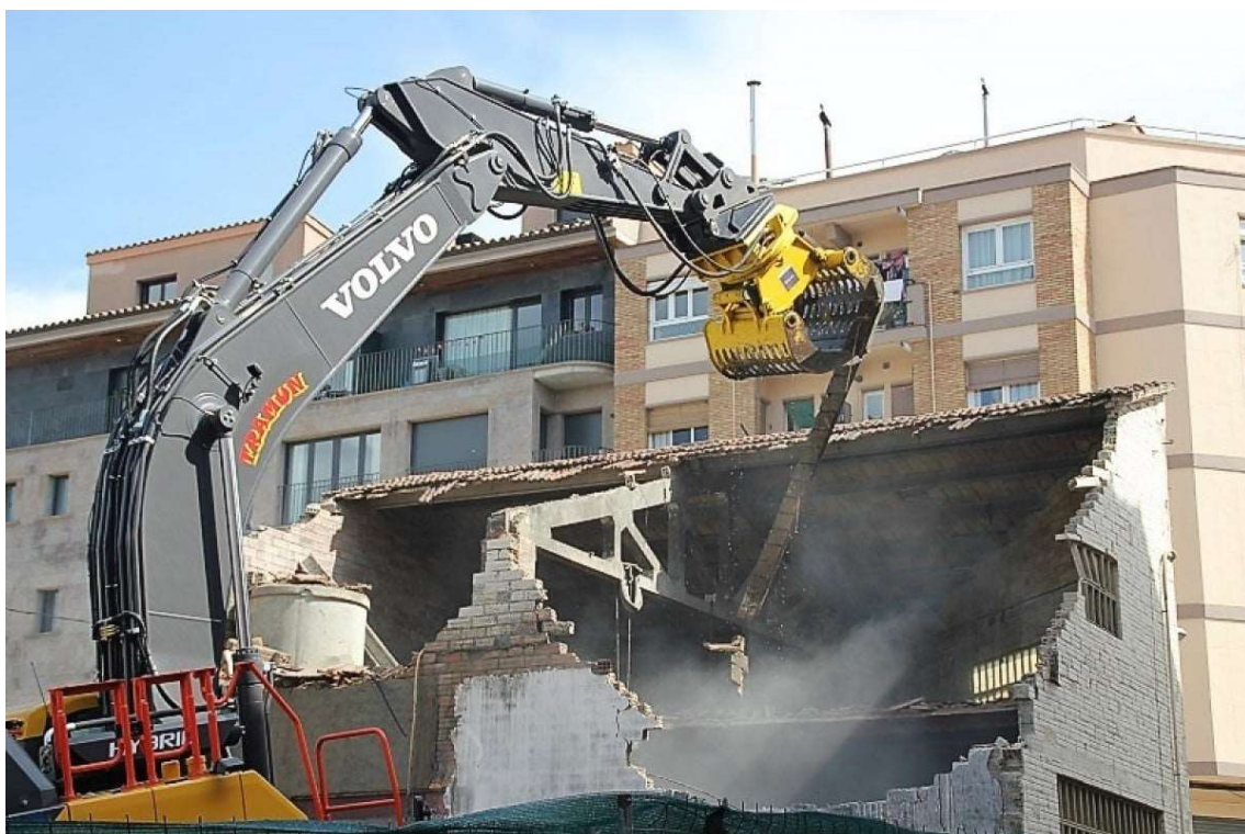
Retirant una de les bigues