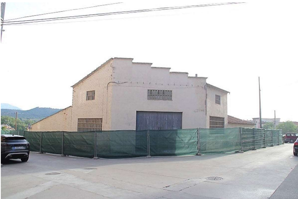
L'edifici, abans d'iniciar l'enderroc