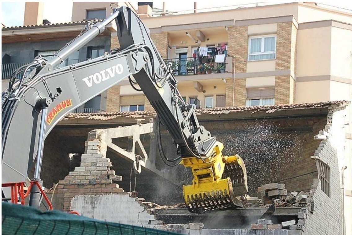
La màquina giratòria retirant la runa de l'interior de l'edifici