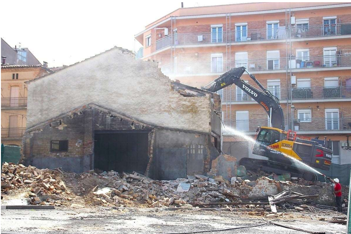
Vista general de l'operatiu