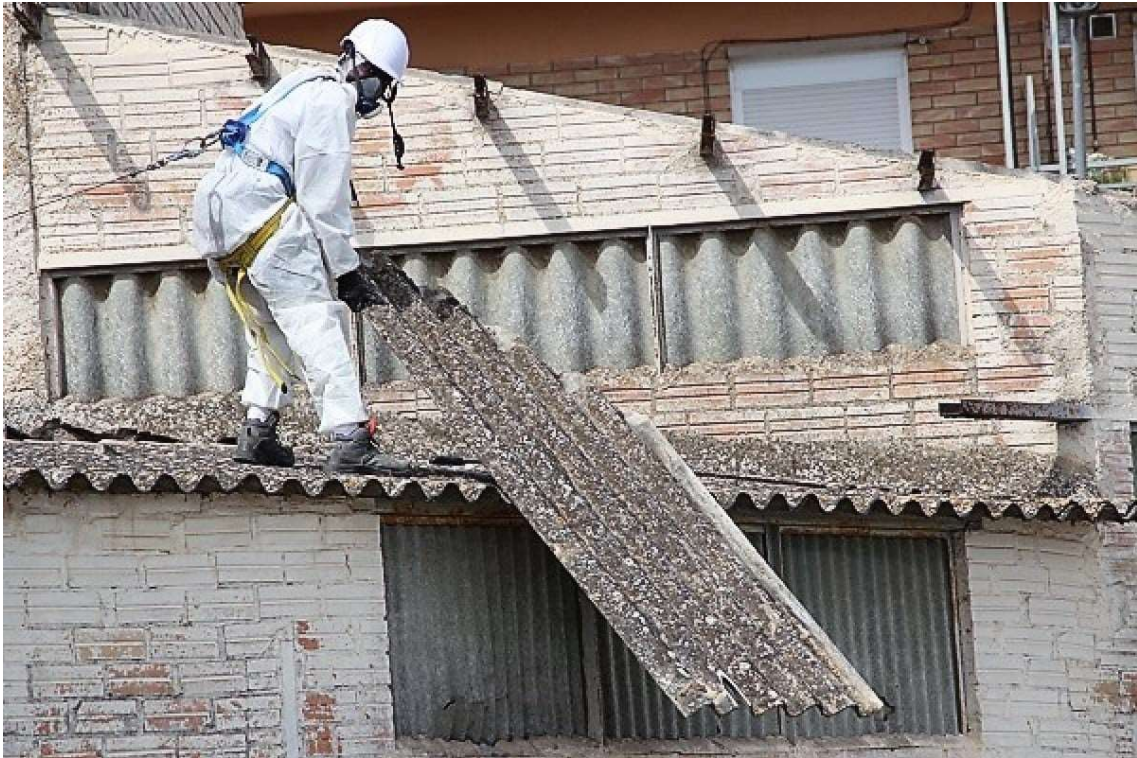
Un operari retirant l'uralita