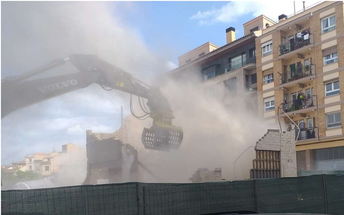
Moment quan s'ensorra tot el sostre

Prèviament a l'enderroc, la setmana passada, tècnics d'Electra del Cardener van retirar el cablejat elèctric de la façana, i una empresa especialitzada va endur-se la uralita de la teulada. També, com és habitual, s'han retirat les teules que es poguessin aprofitar.