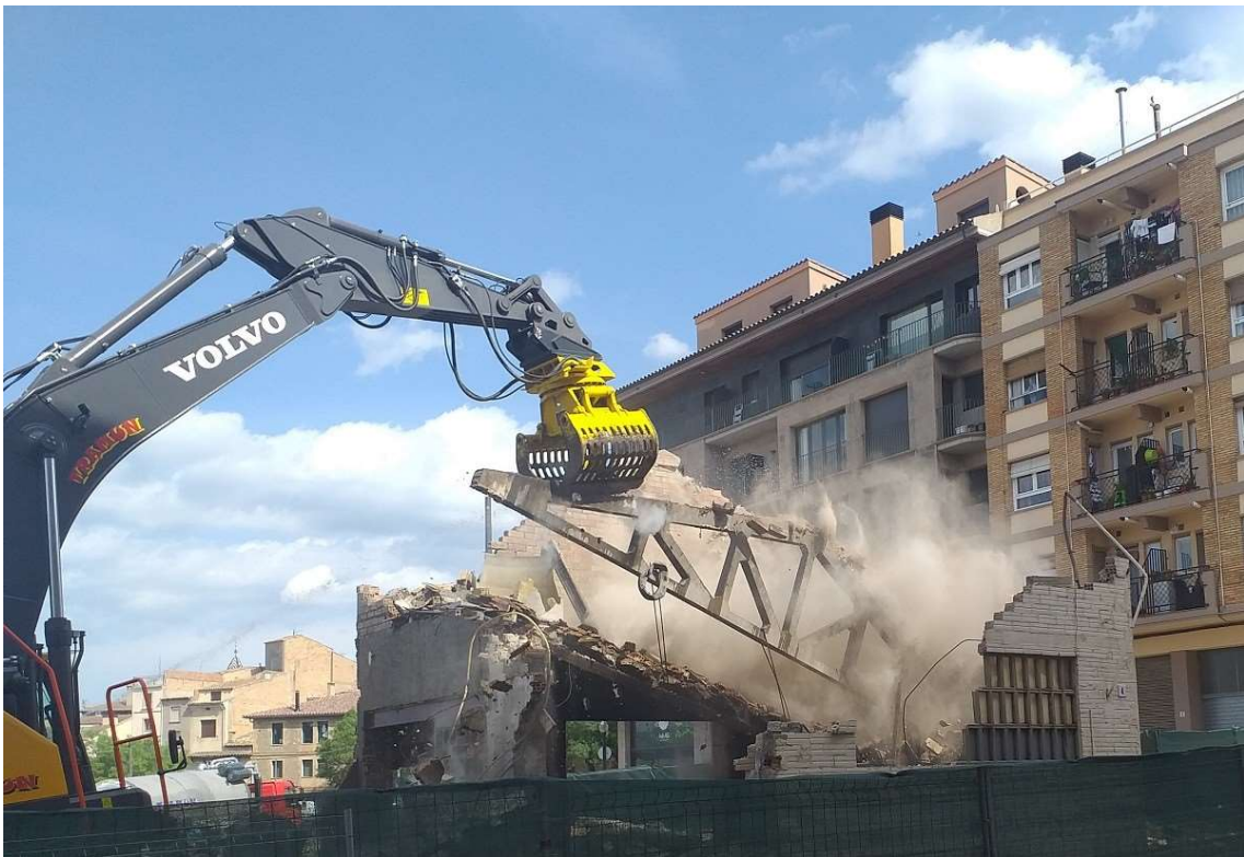
Moment en que es retira la biga mestra de l'edifici

Dilluns a la tarda, una gran màquina giratòria ha enderrocat l'edifici del capdamunt del Camp del Serra, conegut com Cal Caball, ubicat al Carrer Bisbe Vidal i Barraquer, molt a prop del passeig.