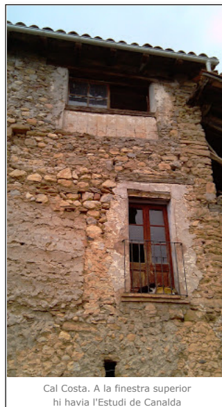
Cal Costa. A la finestra superior hi havia l'Estudi de Canalda

Per pujar a l'estudi calia entrar per cal Costa, l'espai i les condicions no eren les més adequades. El dia 30 d'abril de 1925 en una acta de la Junta Local de primera ensenyança es deia que "las condiciones de salubridad e higiene de los locales es malisima en Canalda" i més endavant continuava "deben hacerse las reformas siguientes: En Canalda procurar un local nuevo o evitar que para entrar en el local-escuela se tenga que pasar por las habitaciones de la Sra. Maestra". A la part central de l'edifici de can Costa hi vivien els propietaris de la casa i a ponent els masovers.