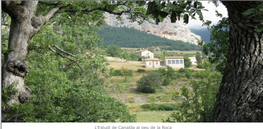
L'Estudi de Canalda al peu de la Roca

Tota escola ha de tenir un pati i en aquesta és difícil determinar-lo ja que està voltada per un camp obert. Ara bé, si ens guiem pels inventaris que l'ajuntament d'Odèn feia, el pati podria ser un espai amb fort pendent situat sobre l'escola. El "Inventario de los Bienes Patrimoniales y los de dominio público" de l'1 de gener de 1958 deia: "Linda por el Norte con tierras de Can Costa, al Sur con la Finca Regué, al Este con el Camino de Canalda y al Oeste con la Finca Regué."