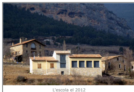
L'escola el 2012