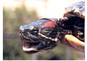
Tortuga de Florida ( Trachemys scripta elegans )

ES RESOL que es suspengui el comerç internacional d'exemplars juvenils de la tortuga de Florida tant als països importadors com als exportadors i que aquells estats que ja tinguin poblacions introduïdes d'aquesta espècie busquin els mitjans humans però efectius per eliminar-les de les seves aigües».