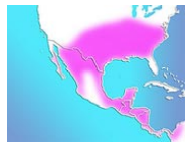
Àrea de distribució de les anomenades tortugues de Florida: centre i nord d'Amèrica

Quan són adultes poden arribar a mesurar uns 30 cm de llargada, es tornen agressives i poden mossegar amb facilitat. La manca d'espai, els problemes d'higiene i aquesta agressivitat són les principals causes per les quals els seus propietaris les alliberen a rius i estanys. Aquí comença el problema.