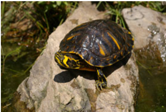
Trachemys scripta scripta

I com que el comerç i les lleis del mercat tenen molt de poder en la nostra societat, els criadors americans van substituir aquesta tortuga per altres subespècies i espècies noves que fins el moment ens eren desconegudes i que la llei els permetia la seva exportació. La Trachemys scripta elegans ja no es comercialitza però el seu lloc ha estat ocupat per Trachemys scripta scripta , Trachemys scripta troostii , Trachemys emolli i d'altres tortugues aquàtiques dels gèneres Chrysemys , Pseudemys , Graptemys , Chelydra , ... El resultat a hores d'ara continua essent el mateix: els nostres ecosistemes aquàtics i les espècies que hi habiten en pateixen les conseqüències.