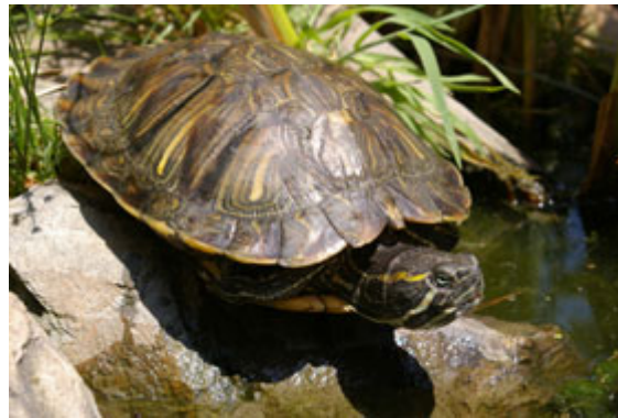
Trachemys scripta troostii