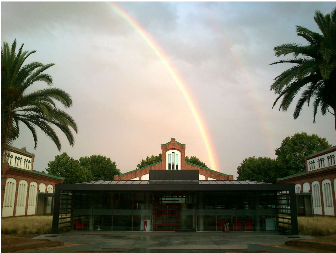
Biblioteca Antoni Comas amb el fons Arc de Sant Martí

També, el fenomen de l'Arc de Sant Martí, que sorgeix després d'una pluja intensa i un ambient sec.