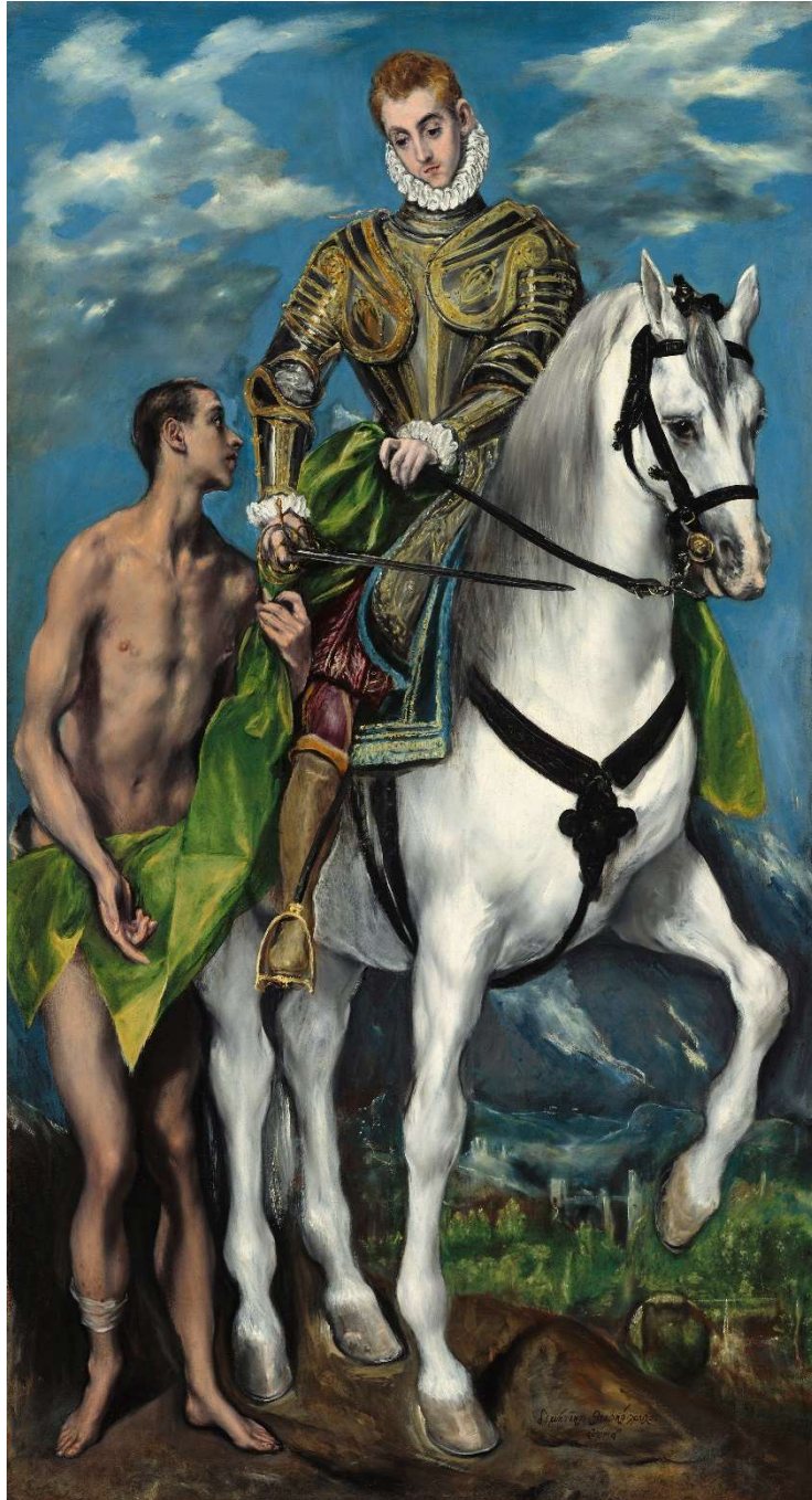
Sant Martí del Greco.

L'Arc de Sant Martí, la gelada i l'estiueig de novembre.