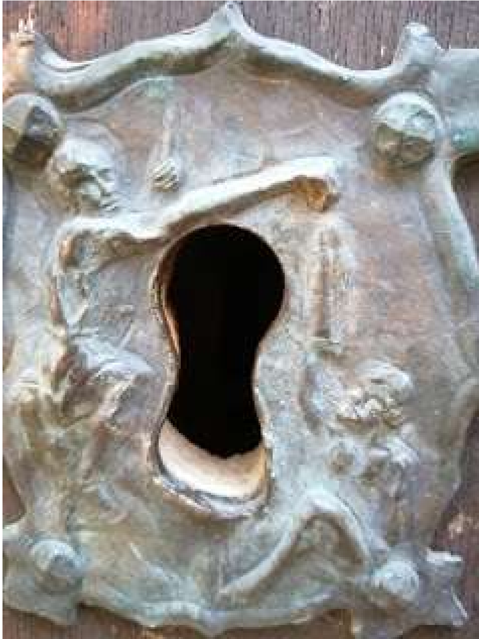
Pany de l'ermita de Sant Martí de Mata.

Es diu que es va conservar aquest tros de roba - recordem l'impuls dels francs sobre les relíquies a l'edat mitjana- i es va consagrar un espai per a conservar-la.