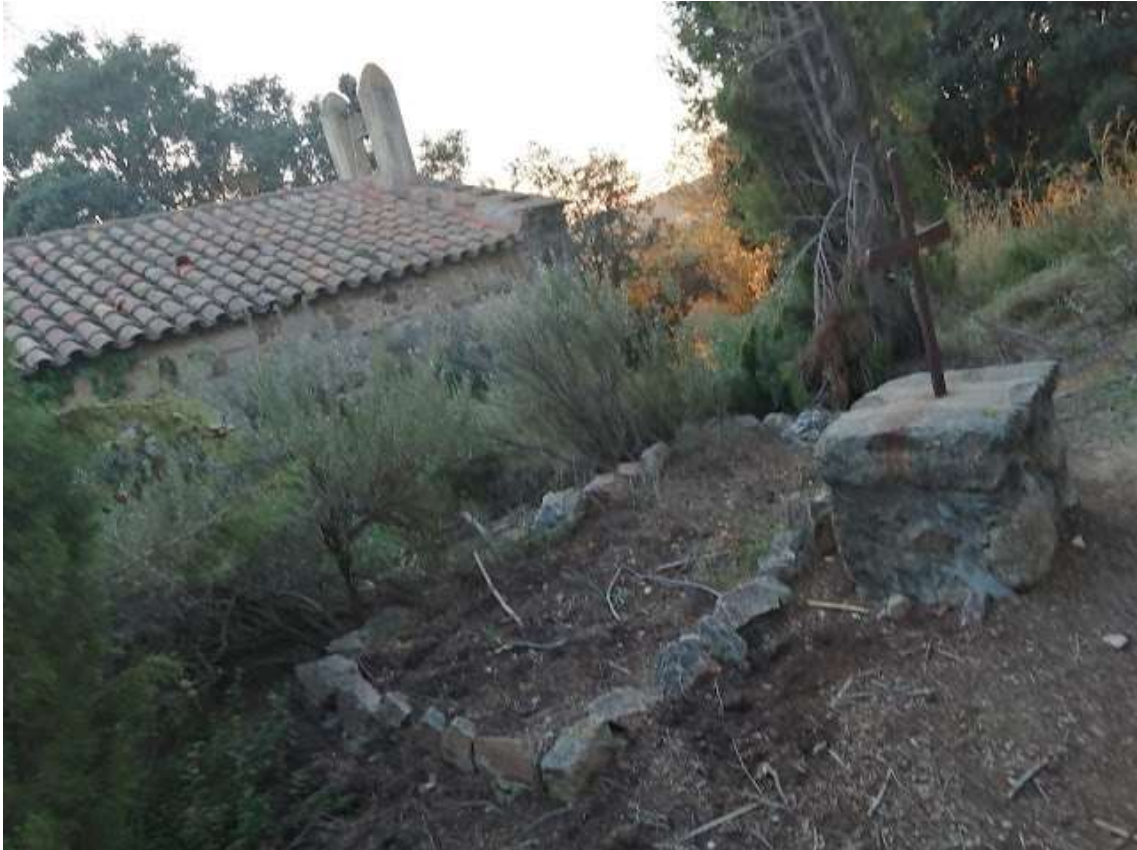
Ermita de Sant Martí de Mata. Foto el dia del Sant 11/11/2020

La tradició i les llegendes van arrelar amb força a Catalunya i tota la cultura popular i el costumari en va assumir i fer seu l'herència del Sant, inclòs assignant fenòmens meteorològics.