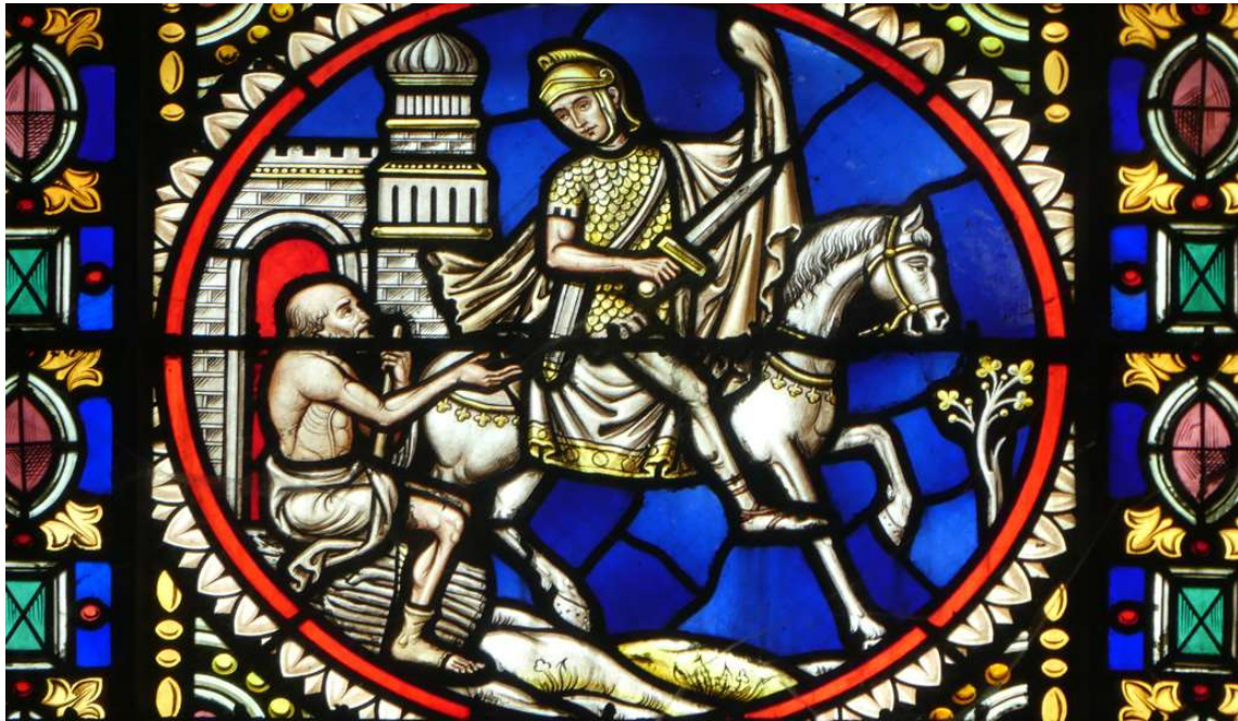
Vitrall de Sant Martí a Sant Martí de Tours (França)

L'11 de novembre l'Església Catòlica i arreu de Catalunya se celebra la festivitat de Sant Martí.