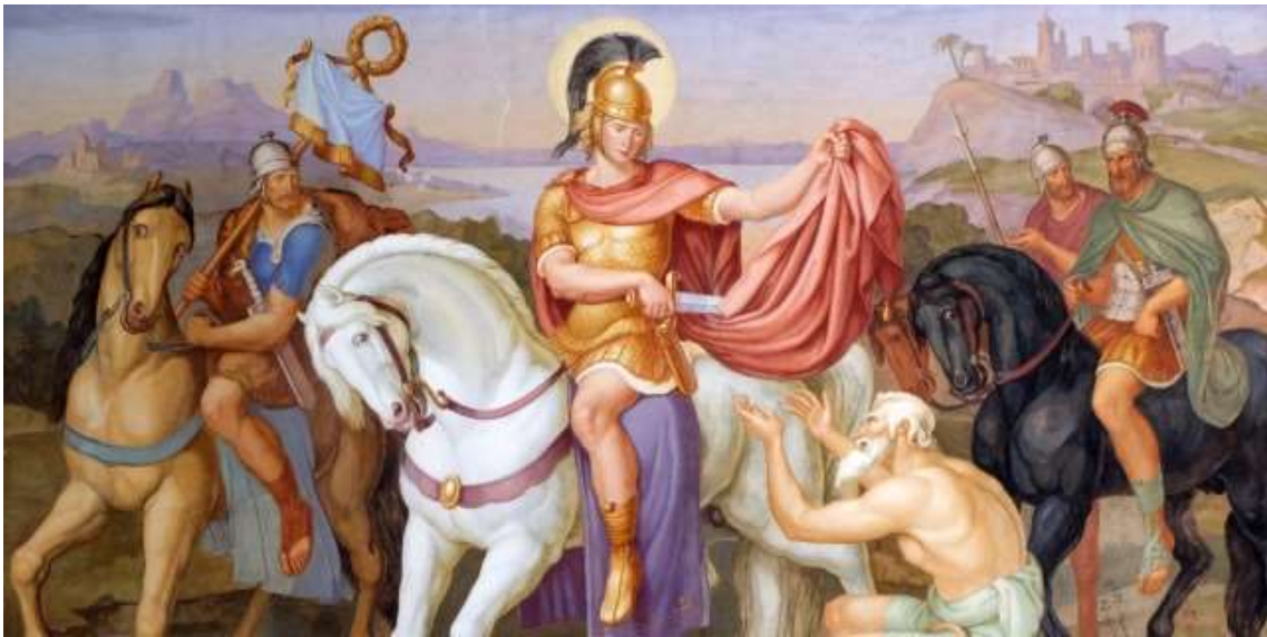
Sant Martí.

S'explica que aquest Sant, que no era pas català, va néixer a la regió de Pannònia (entre Polònia i actual Hongria) a l'any 316. Diu l'hagiografia que era fill d'un militar romà i per això li va posar el nom de Martinus en honor al déu romà de la guerra, Mart.