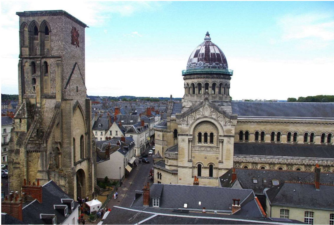
Basílica de Sant Martí de Tours actualitat.

Va viatjar molt per diferents regions i va fundar una comunitat denominada Maius Monasteium d'on van sorgir uns 80 deixebles que van acabar essent bisbes.