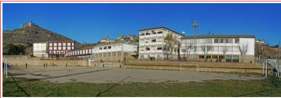
Escola de Formació Professional Castellvell de Solsona, l'actual Escola Arrels II.