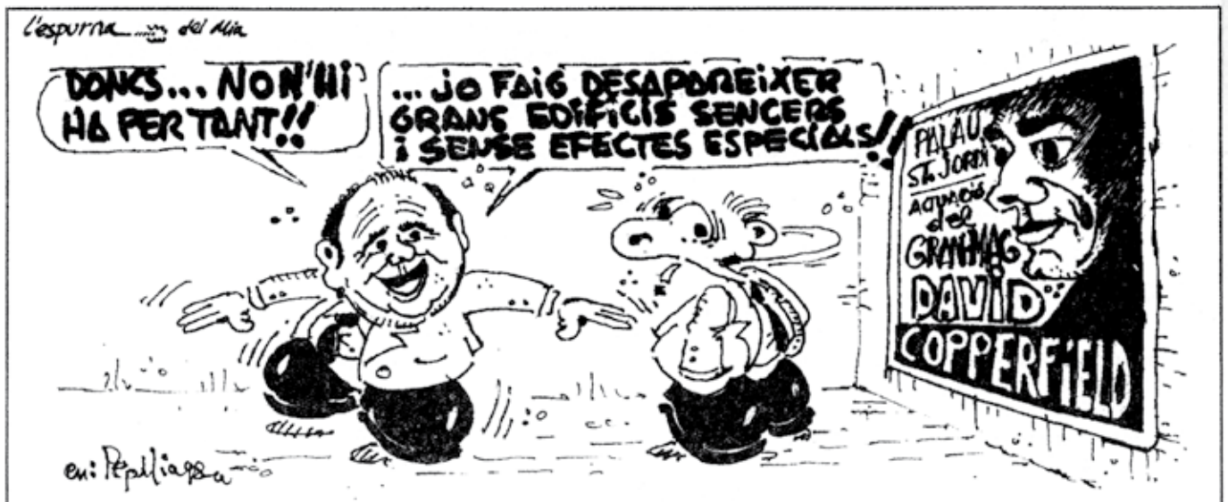
David Copperfield, l'il·lusionista actuava al Palau Sant Jordi de Barcelona.