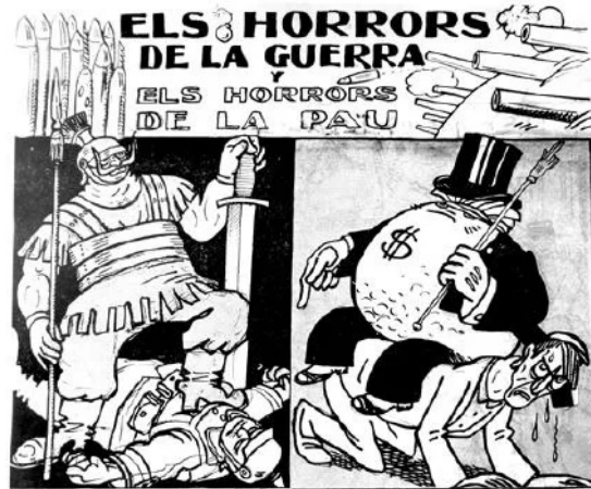
Els Teutons de la Guerra

Devien suposar, potser, que hi parlarien de la inauguració de la Carretera de Solsona a Bassella i efectivament així fou puix, el dia 25 d'abril, el cronista hi explicà "Dia 23. Amb un sol esplèndid i un dia verament primaveral va efectuar-se en aquesta Ciutat, la benedicció de la carretera de Manresa a Bassella(...) als camps de'n Galtanegre , lloc on havia de celebrar-se la cerimònia. Els cotxes invadien el tros de carretera que passa per a dits camps i arreu on girava la vista sols veia caps i més caps de fusells dels pundonorosos individus del Sometén, tot Solsona en massa i un bell estol