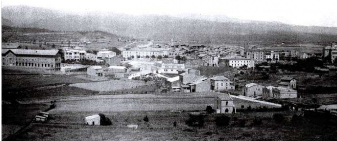
Solsona l'any 1939. S'hi pot veure una part de l'edifici dels Claretians, a costat esquerre

Benvolguts lectors del Celsona, entre els mesos de gener i febrer de l'any que avui recordarem -1939- s'acabà la Guerra Civil a Catalunya, malgrat que no s'havia pas acabat, encara, als territoris que seguïen sostenint la II República, com és ara Madrid o el País Valencià.