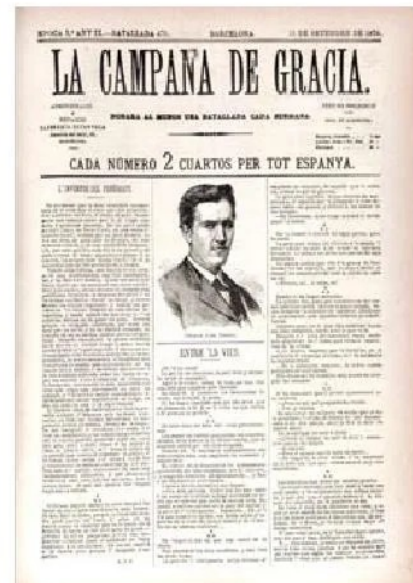
Imatge de Tomàs A. Edison il·lustrant l'article "L'inventor del Fonògrafo", publicat a La Campana de Gràcia, núm. 475 (15 de setembre 1878).