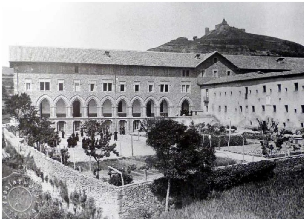
Casa-missió dels Claretians i Seminari Claretí al fons.

"Rosó, Rosó, llum de la meva vida, Rosó, Rosó, no desfacis ma il·lusió."