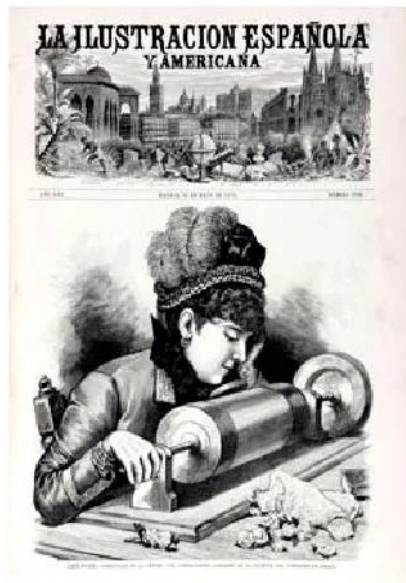
"Prima donna" cantant al receptor del fonògraf de T. A. Edison " LA ILUSTRACION ESPAÑOLA Y AMERICANA, 15-5-1878, n. XVIII, pàg. 305".

Malgrat les greus dificultats que patia el bisbat, però, Solsona seguia comptant amb el Seminari Conciliar que havia obert el primer curs acadèmic l'any 1846, sota la invocació de la Immaculada i sant Ramon. Estava ubicat a l'edifici de l'antic convent -suprimit i abandonat l'any 1835- dels PP. Dominics (actual seu del Consell Comarcal).