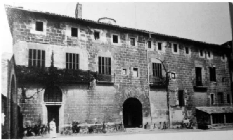
Els Dominics, actual seu del Consell Comarcal, segle XX