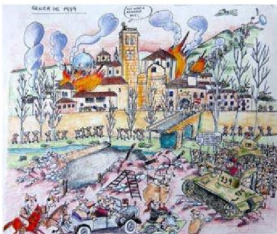
Dibuix de Pi arín Bayés. Llibre Un cop d'ull a la Història de Solsona per Ramon Panes i Abets. Edició: Ajuntament de Solsona, any 1990.

degué afegir als que fins llavors els havia ocasionat la guerra: el d'haver d'abandonar un munt de coses que estimaven i amb el temor que potser no es podrien recuperar.