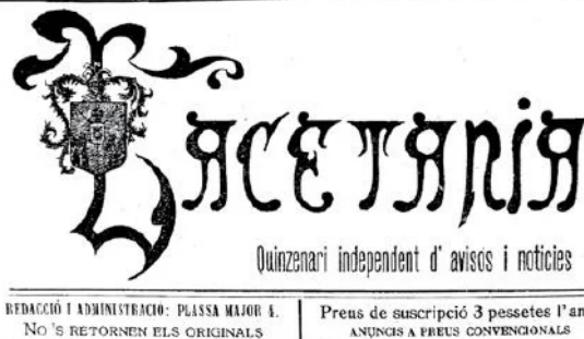
Capçalera del LACETÀNIA núm. 1, any 1914 (ACS)

Any I. Solsona 22 de febrer de 1914. Núm. 1.