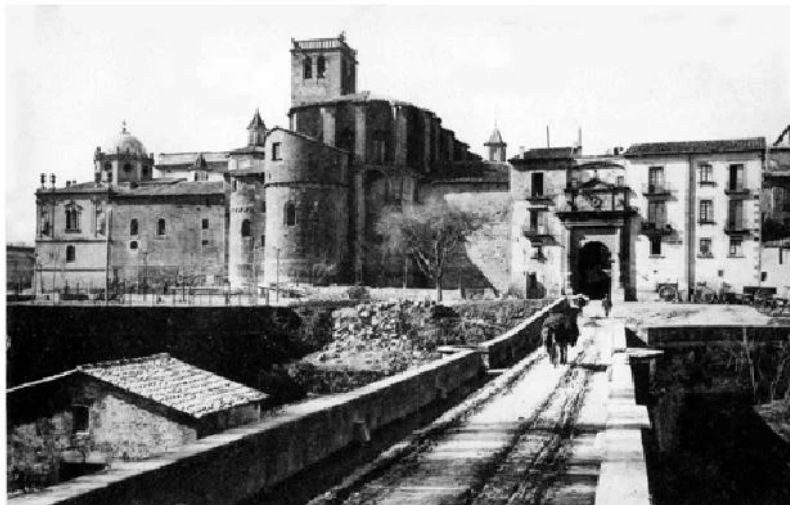
Antic pont d'entrada a Solsona, començaments del segle XX

(...) La entrada a Solsona venint de la carretera de Manresa presenta molt bell aspecte. S'emboca 'l pont monumental y s'ofereix al enfront el gran portal d'entrada a la ciutat, qual portal avui del Pont abans era nomenat de Sant Miquel. L'absis romànic de la Catedral se destaca en un costat.