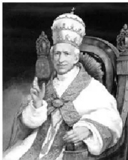
Papa Lleó XIII (10-2-1878/20-7-1903).

En canvi, sols tingueren un rei , el Rei Alfons XII, però potser en parlaren qui-sap-lo perquè es casà amb la seva cosina Maria de las Mercedes de Orléans el dia 23 de gener a la basílica de Nuestra Señora de Atocha (Madrid) i tan sols cinc mesos després enviudà.