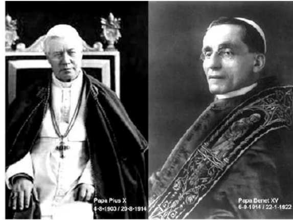
Papa Pius X (4-8-1903 / 20-8-1914), Papa Benet XV (6-9-1914 / 22-1-1922)

"Trista ha resultat enguany. La supresió, per part del ajuntament i Administració de Ntra. Sra. Del Claustre, de focs artificials, músiques, tronades, gegants i demés tradicions, ha donat un aspecte trist nostra ciutat i ha fet que'l comerç se'n resentís de debò(...) Sense'ls tradicionals gegants i focs artificials, la nostra festa major és morta. L'immensa generació que del vinyet i pobles comarcans acudeix a la vigília a presenciar l'encenament del castell de focs, és la nota més típica i lo que dona més vida i animació a nostra ciutat(...) La numerosa concurrència de forasters que durant aquests dies han vingut a nostra ciutat, ha fet que'ls espectacles públics se veguessin forsa concorreguts. El Centre de Cultura Popular, ha donat variades sessions de cinema i teatre. Els balls de l'envelat han estat concurríssims(...) En el Cafè Suiç actuava una Companyia de zarzuela(...) Les funcions religioses foren, com cada any, lluidíssimes(...) La professó se vegé poc concorreguda degut al temps plujós que feu durant tota la tarda(...)"