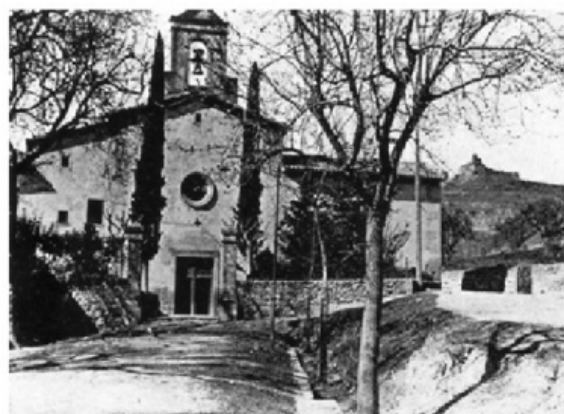
Antiga Església de s Caputxins

Aquells dies molts solsonins marxaren de la ciutat fent cas a les crides que el dia 23 els convidaren, primer, i els forçaren, després, a fer-ho, per la qual cosa un gran dolor es