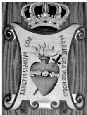
Emblema de la Congregació de les Missioneres Filles del Cor de Maria (Religioses del Seminari de Solsona).

I vet aquí la resumida història de la construcció i inauguració del gran edifici aixecat els anys 20 del segle passat per la comunitat claretiana que vivia a Solsona. Bell edifici actu-