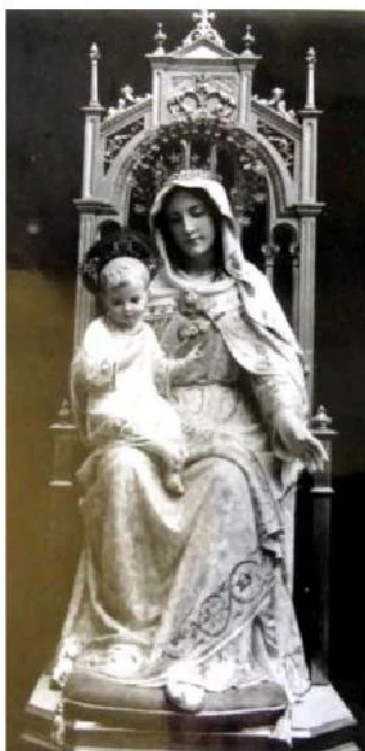
Imatge del Sagrat Cor de Maria que presidia l'església del Cor de Maria de Solsona abans de la passada Guerra Civil..

Sí que devien estar ben segurs els redactors del LACETANIA que hi parlarien, però, dels estimats Missioners Fills del Cor de Maria , presents a Solsona des del dia 11 d'agost de 1878. I, de fet, ben aviat, el dia 7 de juny, ho farien amb motiu de la solemne festa de benedicció i entronització de la nova imatge del Cor de Maria en un altar nou . Imatge que havia estat fabricada pels tallers Rius i adquirida per subscripció popular. El dia 7 de juny, doncs, hi publicaren: "Dijous va començar en la Casa-Missió d'aquesta Ciutat un solemne Triduo per a festejar la solemne benedicció i estrena d'una imatge del Puríssim Cor de Maria . Feu la benedicció l'Il·lm. Sr. Bisbe, predicant durant tres dies el qui fou Superior d'aquesta residència, el R.P. Mariano Costa. El diumenge, dia 7, hi haurà solemne comunió que distribuirà l'Il·lm Sr. Bisbe. A la tarda solemne processó en que serà pasejada, en artística carroça-automovil, l'imatge del Puríssim Cor. Durant aquests dies l'iglesia dels Missioners era petita per a poguer dar cabuda a la multitud de fidels que hi assistiren".