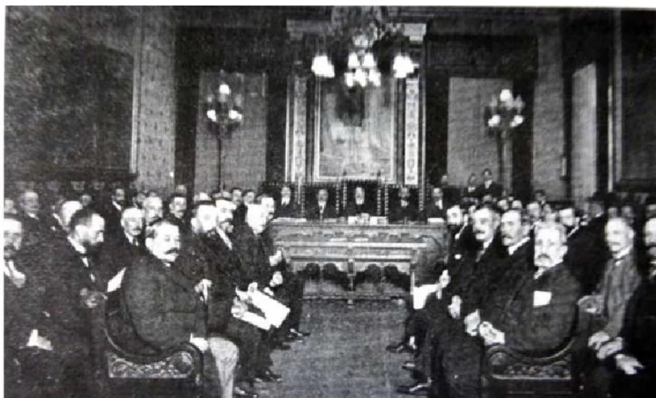
Assemblea de les Diputacions Catalanes 9-1-1914, presidida per Enric Prat de la Riba, on s'aprovà l'Estatut de la Mancomunitat de Catalunya

se barrejaven amb els crits de ¡Visca Catalunya i ¡Visca la Mancomunitat Catalana!... "