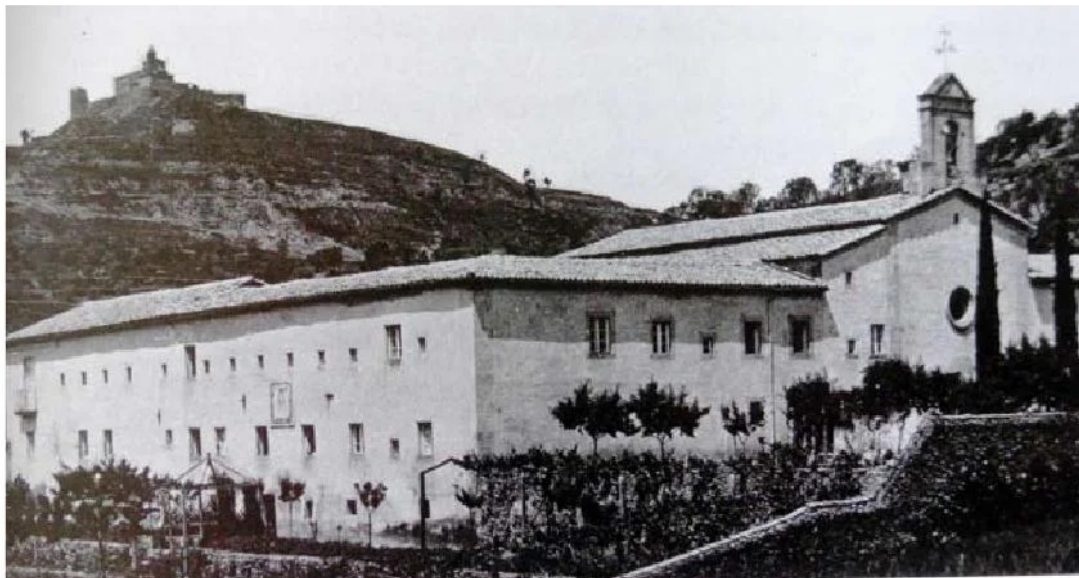
Antiga casa missió dels claretians a Solsona i església del Cor de Maria.

"Solsona i els Claretians és ben bé una història d'amor compartit, una història d'intercanvi d'amor. Solsona ha donat molt i molt als Claretians, i els Claretians -permeteu-me que us ho digui- s'han també sacrificat molt i molt pels solsonins."