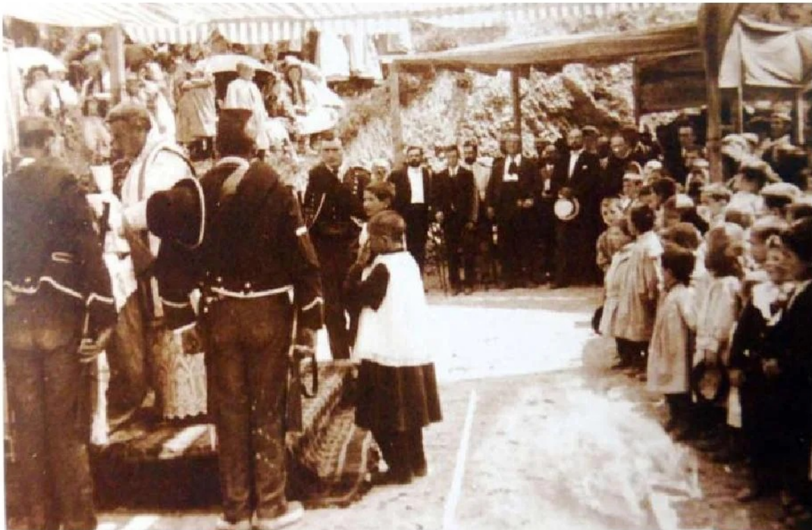
Inauguració de la carretera de Bassella a Solsona, any 1914

de noies que constituïen, entre aquella munió de gent, una nota de poesia, puix fins els establiments de comers havien tencades ses portes(...) Els forts picaments de mans