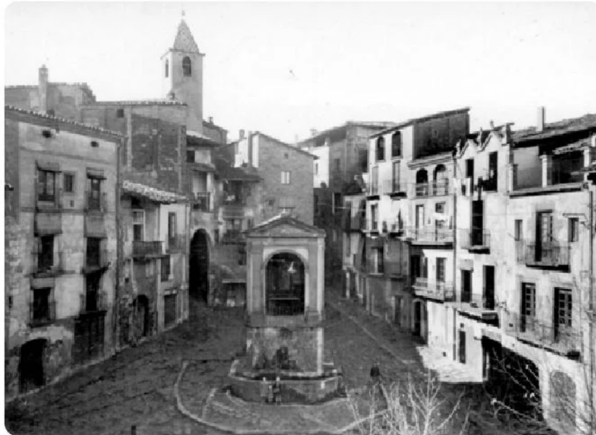
Plaça de St. Joan. Cal Bodegó, 1a casa costat esquerre; cal Falp, 1a casa costat dret

"Fa una lluna clara i una nit serena, jo m'estic a la plaça de St. Joan; damunt les finestres cau la lluna plena, cau damunt la pica que la fa brillant."