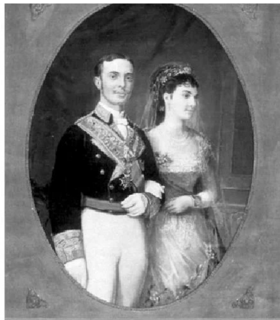
Boda de Alfonso XII i Maria de las Mercedes de Orléans (23-1-1878).

En canvi, sols tingueren un rei , el Rei Alfons XII, però potser en parlaren qui-sap-lo perquè es casà amb la seva cosina Maria de las Mercedes de Orléans el dia 23 de gener a la basílica de Nuestra Señora de Atocha (Madrid) i tan sols cinc mesos després enviudà.