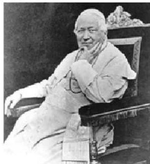
Papa Pius IX (18-6-1845/7-2-1878).

De fet, aquell any els solsonins també tingueren dos Papes : Pius IX fins al dia 7 de febrer, i Lleó XIII des d'aquest dia.