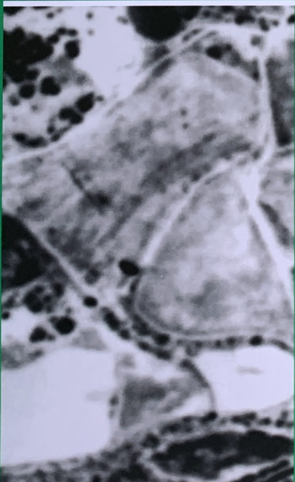
Aquí podeu veure la mateixa imatge que abans però en l'actualitat. Encara existeix un dels dos camps entremig dels quals estava el pi. L'altre, però, ha desaparegut en favor dels xalets.