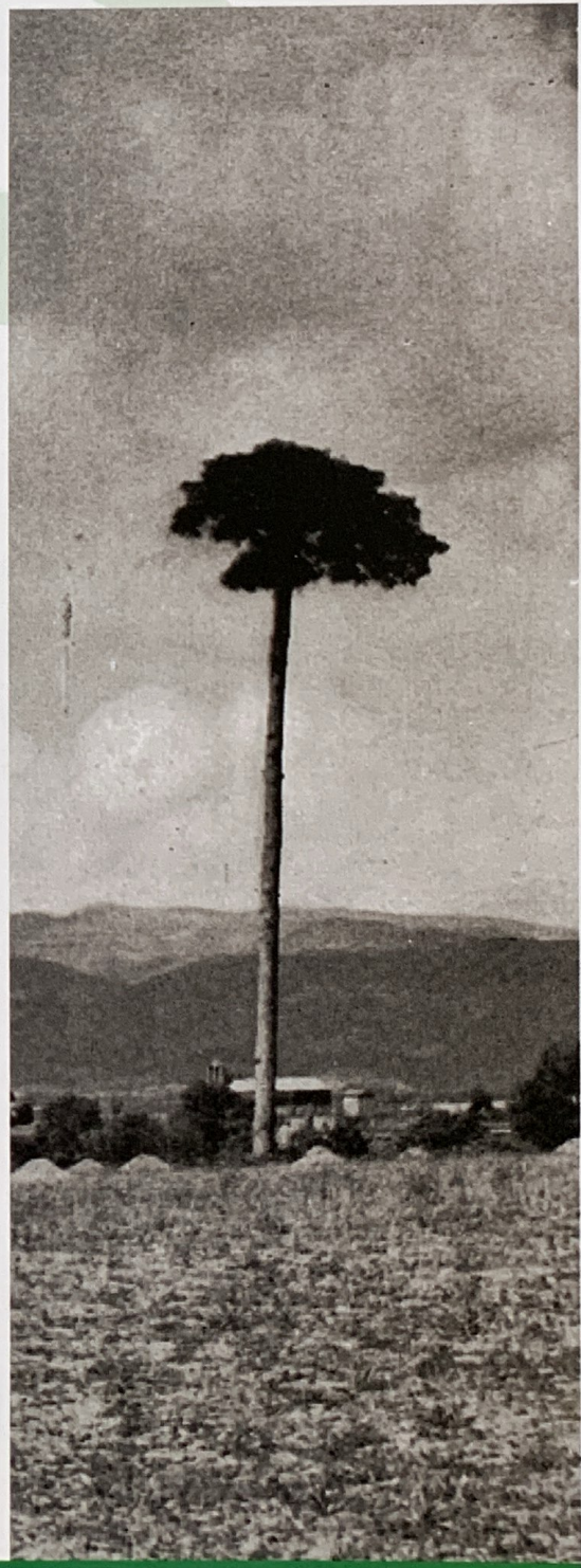
Font: Família Caelles . El Pi de Sant Just fotografiat el 1954. © 2004 DGB-INIA.