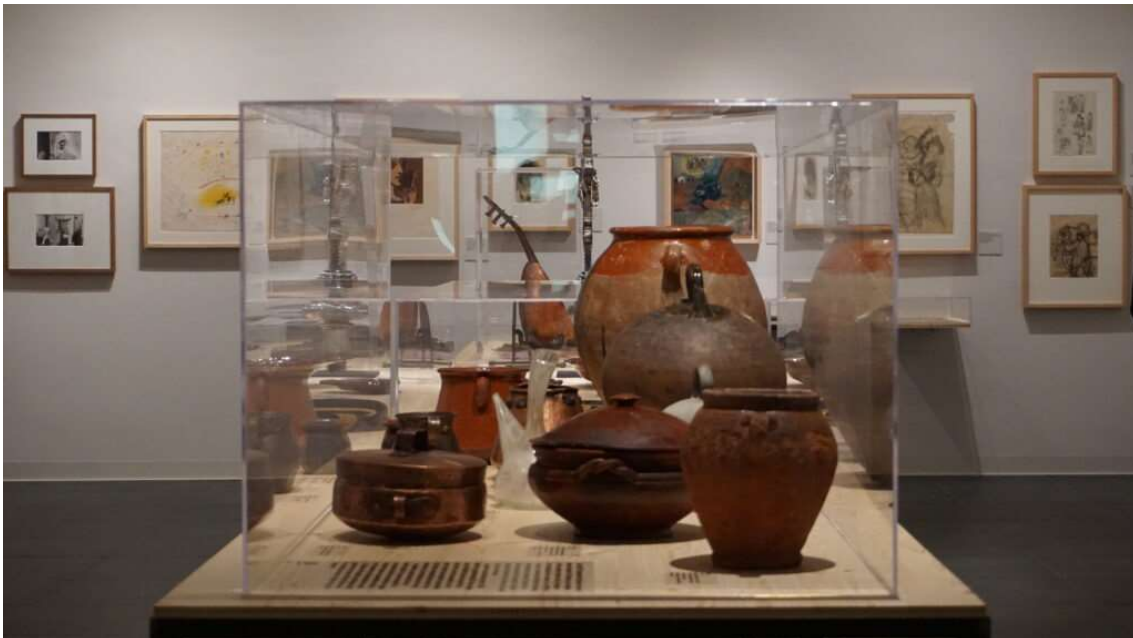
Col·lecció Etnogràfica del Solsonès, Ajuntament de Solsona. Museu Diocesà i Comarcal de Solsona. MDCS 20197

La fascinació de Picasso per les festes populars catalanes, que segurament gaudia moltíssim amb els seus amics, està present també a l'exposició. Dibuixa caps de cavall guarnits per les festes de Sant Antoni i l'any 1900 participa en el concurs de cartells del Carnaval barceloní, un esbós d'un dels quals s'inclou a la mostra. En la portada del diari El Liberal del 5 d'octubre de 1902, Picasso publica un dibuix extraordinari de la gran desfilada de temàtica antiga que es va organitzar per a les festes de la Mercè, que aquell any van ser especialment llüides. S'hi veu un elefant mecanitzat, una mena de Colosseu i molts personatges, entre ells, en primer pla d'esquenes, una mare amb el seu fill que recorda a les maternitats de l'Època Blava. Lamentablement aquest dibuix s'ha perdut com també està desaparegut un dibuix del 1902 amb un cavall i una mare amb fill que Picasso va donar per il·lustrar un número de setmanari La Humanitat, portaveu del partit Esquerra Republicana de Catalunya, ja a l'exili.