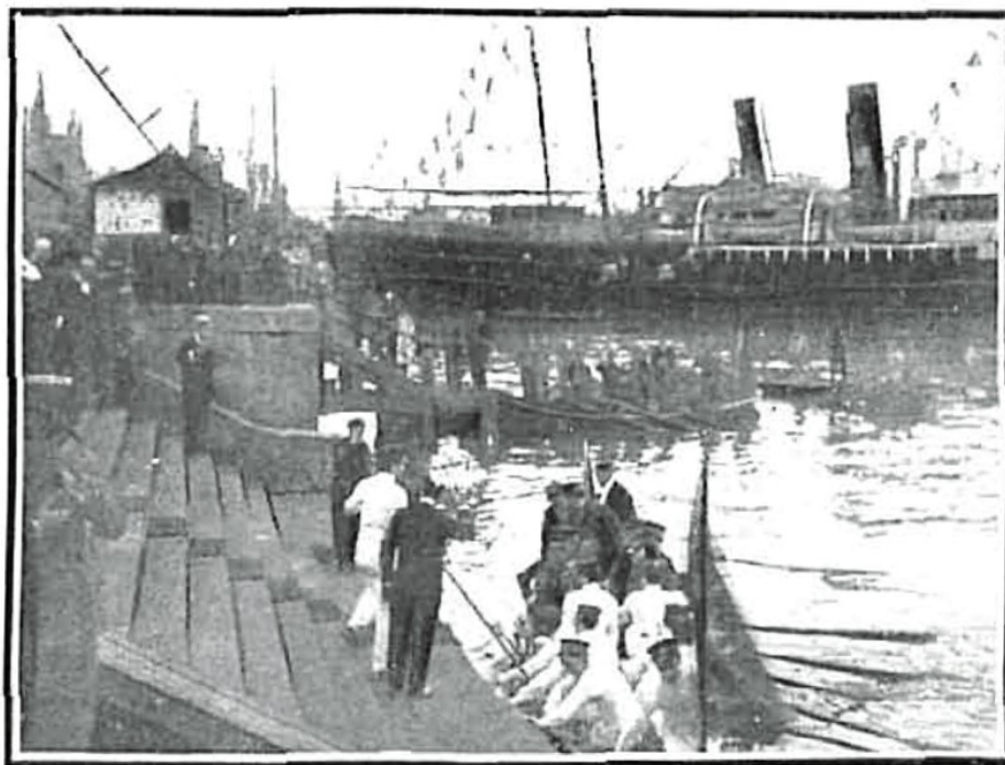
Fotografia que capta el desembarcament del rei Alfons XIII al Moll de la Pau de Barcelona pels volts de les 07:40 del 20 d'octubre de 1907 publicada a la revista Nuevo Mundo del 2 d'octubre de 1907.