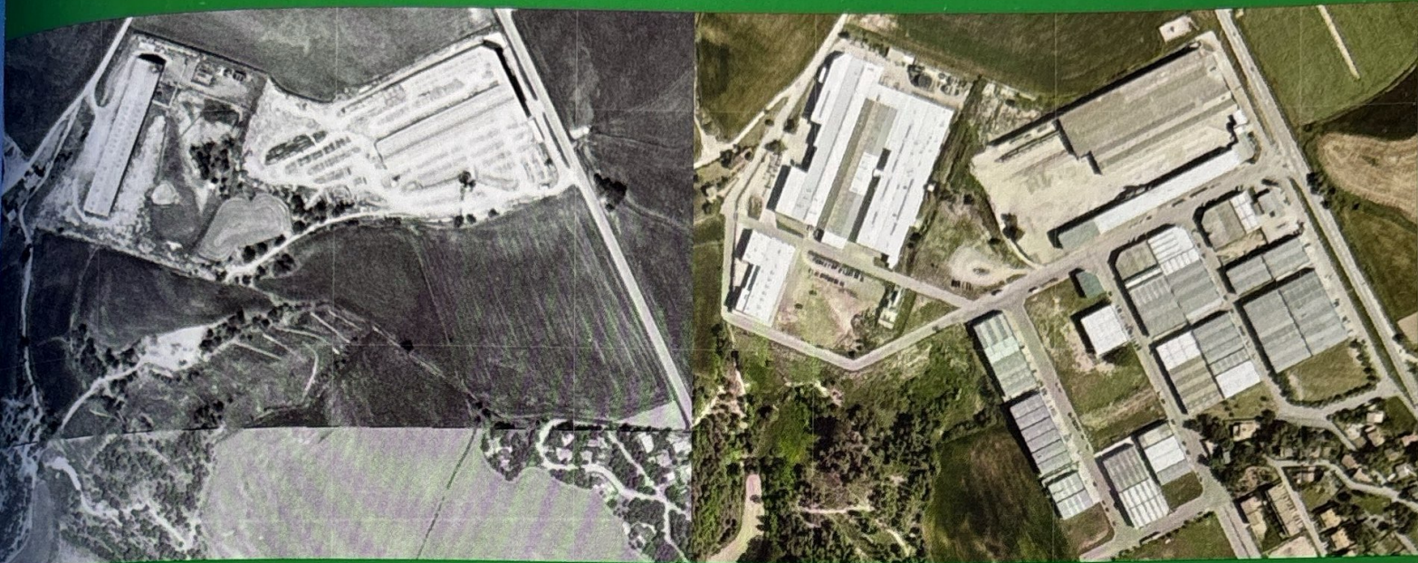
Imatge de l'esquerra, de 1987, testimonia la presència de les empreses Textil Olius SA, a la parcel·la de la banda l'esquerra, i Prefabricats del Solsonès SA, a la de la dreta, vora la carretera C-55. L'espai que actualment ocupa l'ampliació del polígon industrial entre sengles empreses i el carrer Lladurs era, en aquell moment, espai de cultiu.

A partir de 1991, l'ampliació del polígon industrial esdevingué efectiva amb la construcció d'una nau al carrer del Timó i una altra al xamfrà dels carrers del Romaní i de l'Espígol. En paral·lel, Texareas SL hi construï, vora la carretera C-55, una estació de servei – gasolinera. Olius avançava, d'aquesta manera, cap a la industrialització de la seva economia, una transició sectorial certificada l'any 1994 per la voluntat de l'Ajuntament d'ampliar el sòl industrial del municipi. El cartipàs de l'alcaldia entre Valls i Farré no afectà, en cap cas, la política d'ampliació de l'oferta de sòl industrial al Pi de Sant Just. Contràriament, el gener de 1996 s'aprovava inicialment el Pla Parcial del Polígon Industrial Olius-2, promogut per Solars Polígons Industrials SA, mentre l'edificació de les parcel·les disponibles arran de la primera ampliació continuava sent efectiva. L'aprovació definitiva del projecte s'esdevindria el 7 de març de 1997.