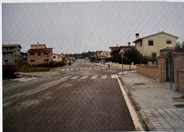
Comparativa del carrer del Duc del 2003 respecte a la seva visió actual. Podem veure com en pocs anys la proliferació d'habitatges en aquesta via és més que evident.

El projecte concebia, com s'ha esmentat, la institució d'un centre físic per al nucli: una plaça tancada pel nou consistori, al nord-oest, i dos edificis plurifamiliars, al nord-est i al sud-oest. Per a l'Ajuntament, es tractava d'un «punt central on poder concentrar els serveis bàsics de la urbanització. En altres paraules, una plaça on pugui haver-hi un local de trobada, un quiosc, un bar, una fleca... que, a més de donar a la urbanització un punt de referència per a tots els habitants de la zona, intenti que els serveis estiguin ben localitzats i siguin viables econòmicament.» (Celsona Informació, núm. 96, 19 de febrer de 1999).