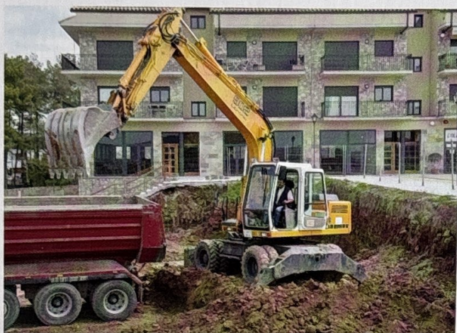
L'abril del 2009 la maquinària ja començava a treballar en la construcció de la nova seu per a l'Ajuntament d'Olius.

un any més tard, el dia 23 de març de 2010, quedava adjudicada a Construccions Josep Clotet S.A. l'execució d'accessos adaptats de la seu consistorial, mentre que el 16 de juny de 2011, Construcciones y Contratas Novex S.L. assumí per concurs l'ampliació de l'edifici d'equipaments municipals, amb la construcció d'una sala polivalent i auditori amb capacitat per a 50 persones.