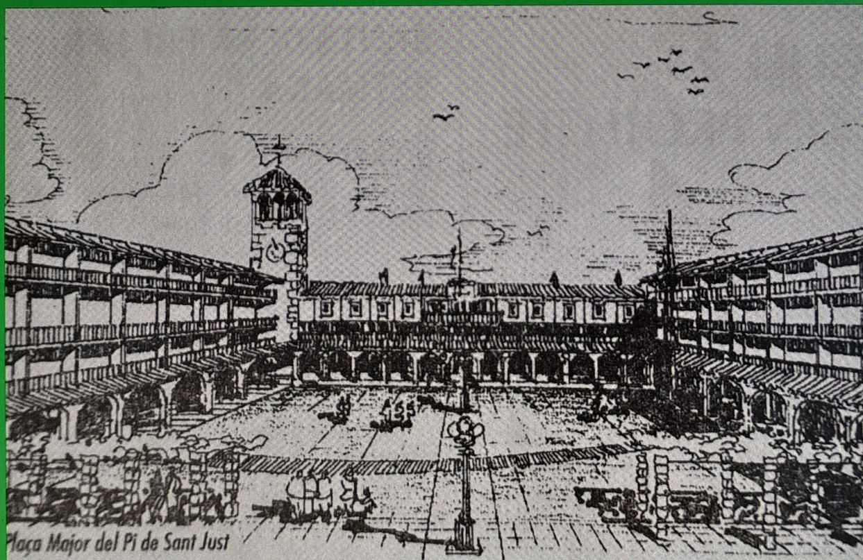
Una projecció inicial contemplava la construcció d'una plaça porxada, amb la seu consistorial al fons de la imatge i dos blocs d'habitatges plurifamiliars, un a cada costat de la plaça. Font: Celsona Informació, núm. 96, 19 de febrer de 1999.

El projecte concebia, com s'ha esmentat, la institució d'un centre físic per al nucli: una plaça tancada pel nou consistori, al nord-oest, i dos edificis plurifamiliars, al nord-est i al sud-oest. Per a l'Ajuntament, es tractava d'un «punt central on poder concentrar els serveis bàsics de la urbanització. En altres paraules, una plaça on pugui haver-hi un local de trobada, un quiosc, un bar, una fleca... que, a més de donar a la urbanització un punt de referència per a tots els habitants de la zona, intenti que els serveis estiguin ben localitzats i siguin viables econòmicament.» (Celsona Informació, núm. 96, 19 de febrer de 1999).