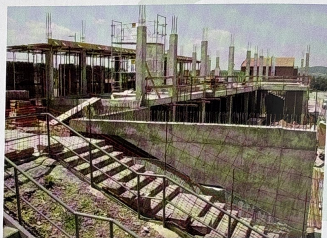
Tres mesos després de l'inici les obres avançaven a un bon ritme.