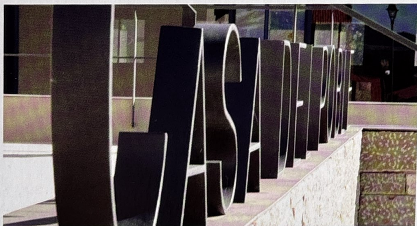
El 2011 la casa del poble ja estava enllestida. El consistori oliuenc tenia una nova llar.