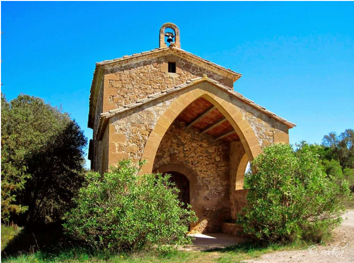
Ermita de la Mare de Déu de Sant Mer o també de sant Mamet, en el terme de Madrona.