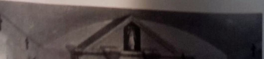
Sol. 151 Sant Pere Peà; m. Navès; Cp.; Parserisses; s/c (292, 5°17'12" - 42°04'15"). fotos: (a dalt) Vista exterior de la capella amb la façana mig coberta d'heura (juliol 1981); (al mig) Interior de la capella amb la capçalera (juliol 1981).