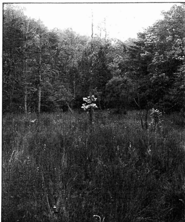
Aiguamoll format per les fonts del Tiriot en l'actualitat.