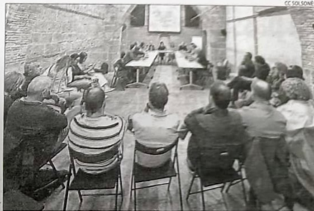
Reunió amb la delegada del Govern, Èlia Tortolero.