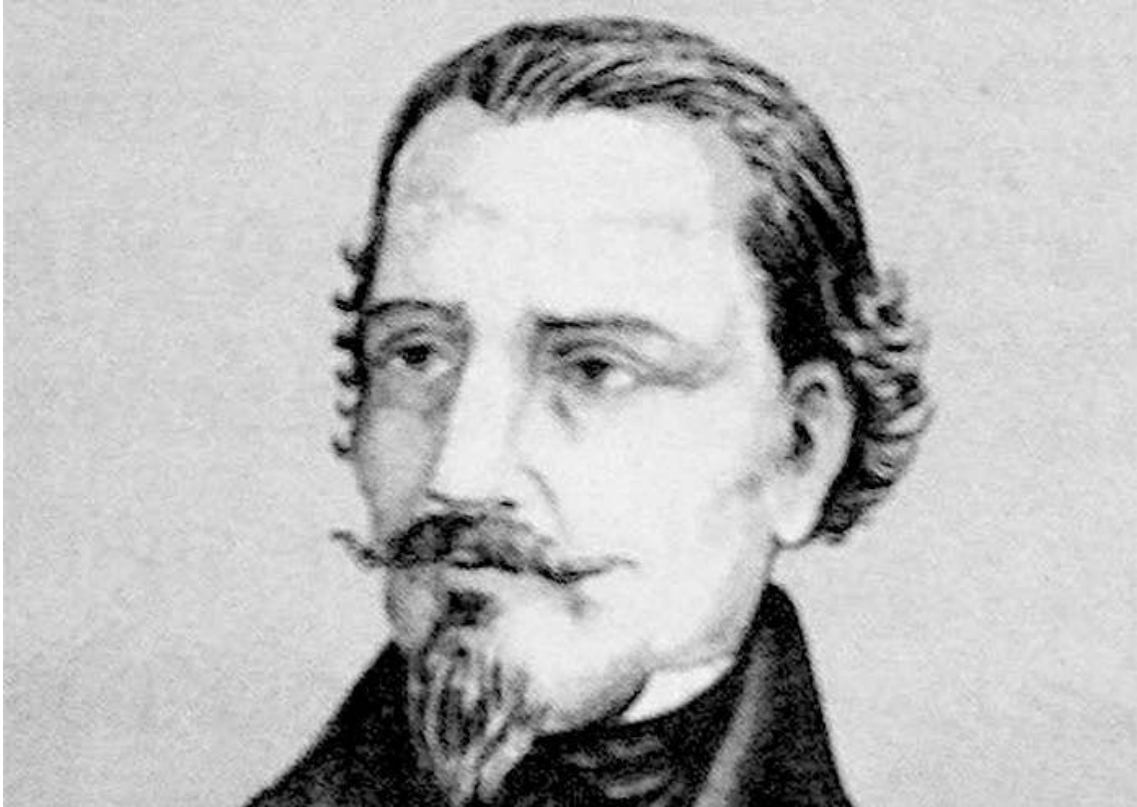
Gaietà Ripoll i Pla (Solsona, 22 de gener de 1778 - València, 31 de juliol del 1826)

Sebastià Carratalà - 22/01/2026 – Diari La Veu del País Valencià